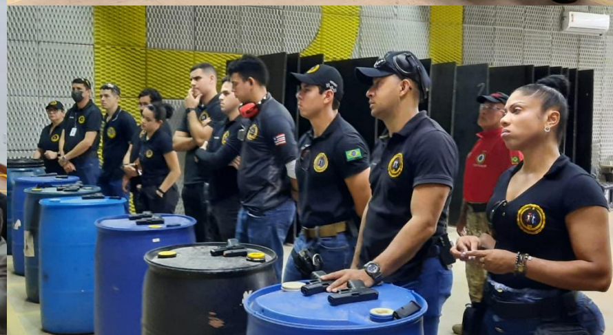
Policiais Militares da DSIGM em treinamento no estande do CATO/PF.