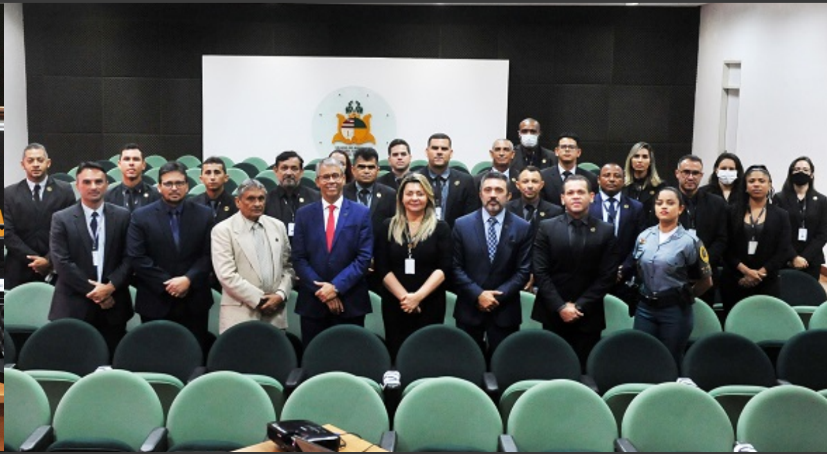
Membros da CPSI e supervisores de segurança da DSIGM acompanharam o ato de entrega de equipamentos.