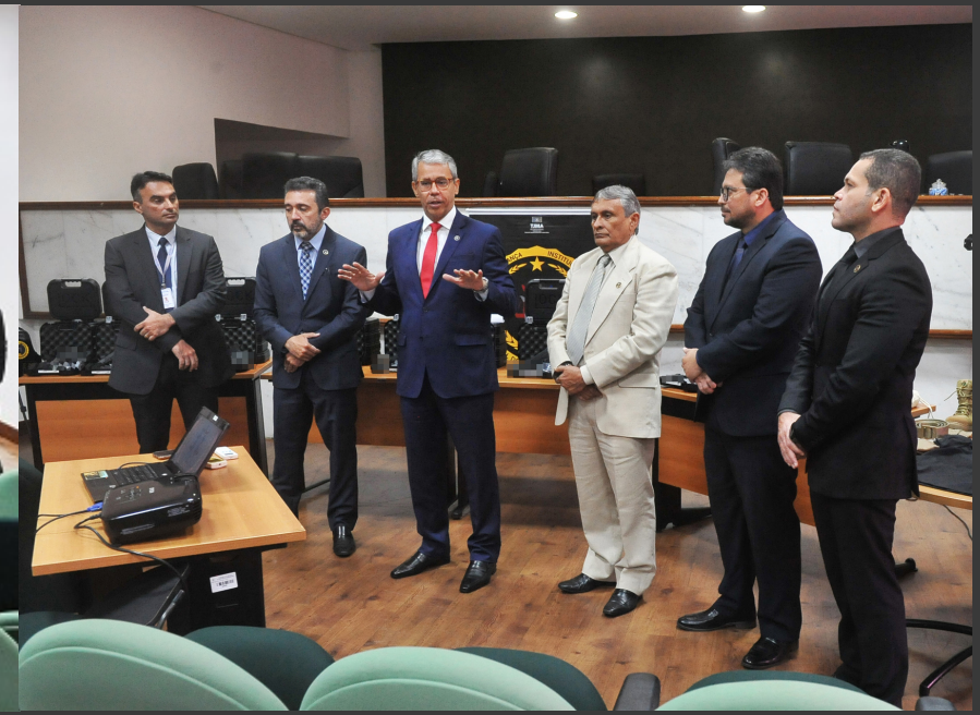
A apresentação dos itens de segurança ocorreu durante reunião da CPSI.