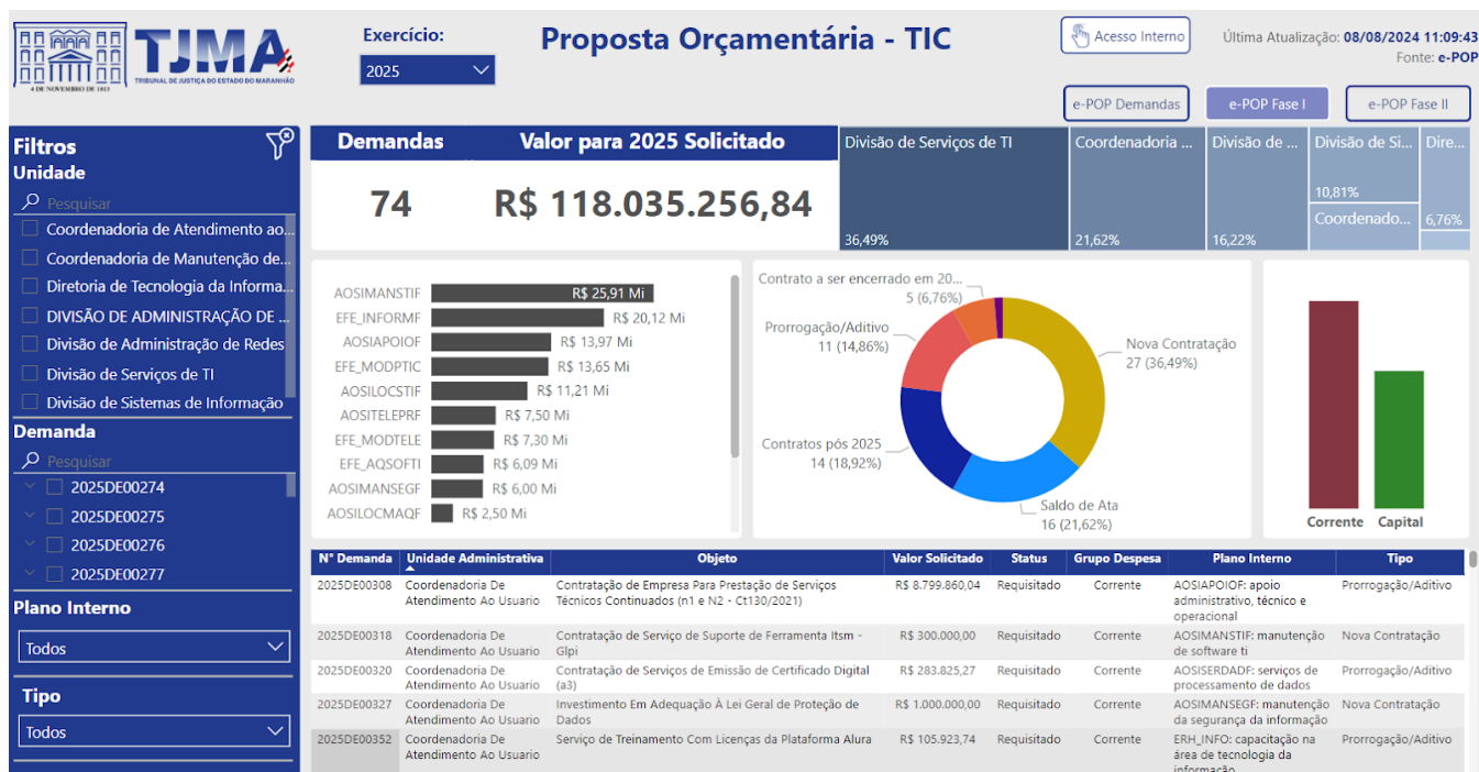
Figura 02 - Painel da Proposta Orçamentária de TIC 2025

Em seguida, o diretor Cláudio Sampaio apresentou o painel ( dashboard ) da Proposta Orçamentária de TIC 2025 (vide figura 02) com visão gerencial baseada em todas as demandas cadastradas no sistema E-POP na fase I. De forma resumida, ele destacou que foram identificadas 74 demandas de TIC, totalizando um valor orçamentário de aproximadamente R$118 milhões. Dentre essas demandas, 31 são destinadas ao custeio de contratos assinados, representando cerca de R$36 milhões. O saldo restante contempla 43 demandas previstas para novos investimentos, utilizando saldo de ata ou licitação, no valor aproximado de R$81 milhões.