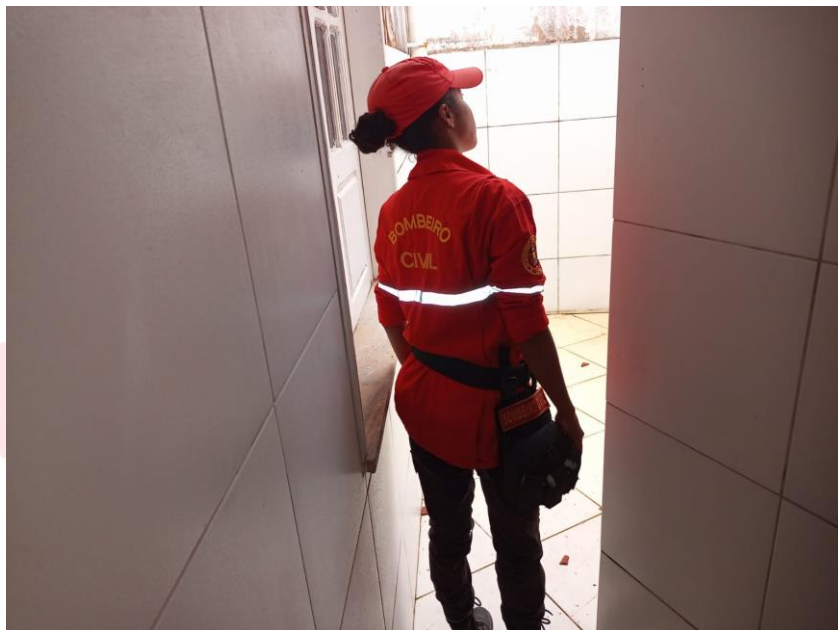
Foto 04. Defesa Civil Municipal dia 26/04/2022. Situação interna antes da subida da maré às 10:08 min.

EMAIL- secmeioambientevtm@gmail.com / defesacivilpmvtm@gmail.com