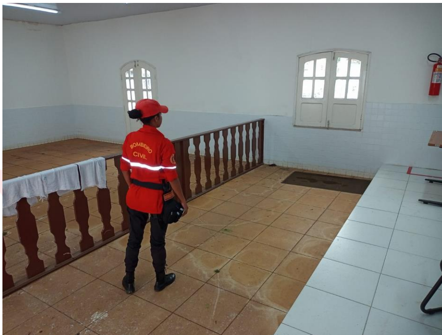
Foto 02. Defesa Civil Municipal dia 26/04/2022. Situação interna antes da subida da maré às 10:04 min.

EMAIL- secmeioambientevtm@gmail.com / defesacivilpmvtm@gmail.com