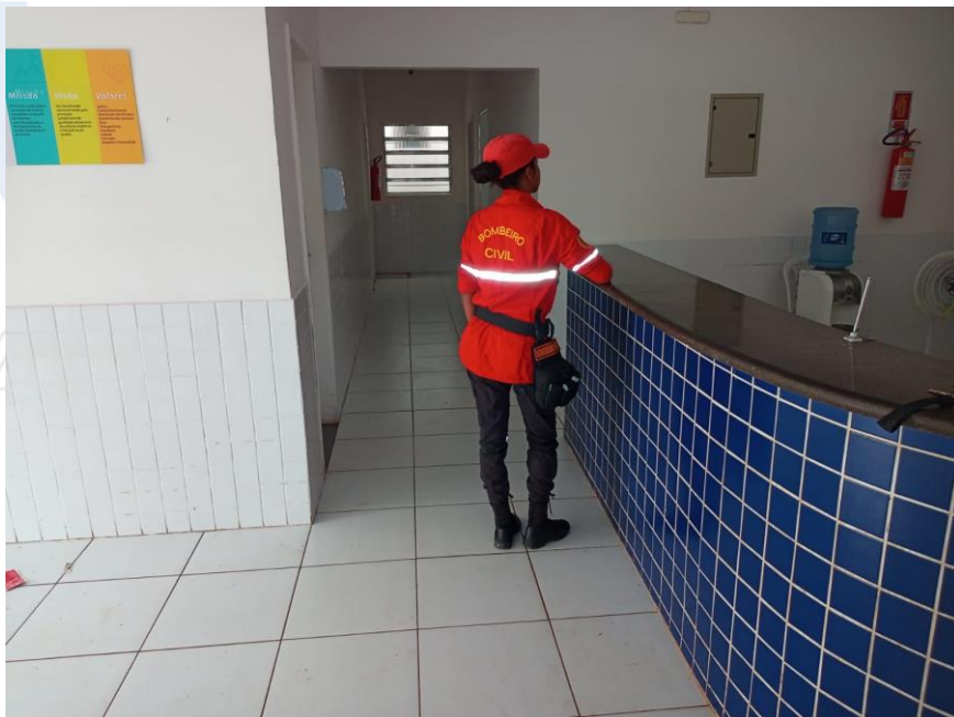
Foto 01. Defesa Civil Municipal dia 26/04/2022. Situação interna antes da subida da maré às 10:02 min.

As fotos abaixo, mostram que com a influência da maré, o recinto em questão, tem boa parte de suas salas inundadas pelas águas que estão em contato com os esgotos dos arredores do estabelecimento.