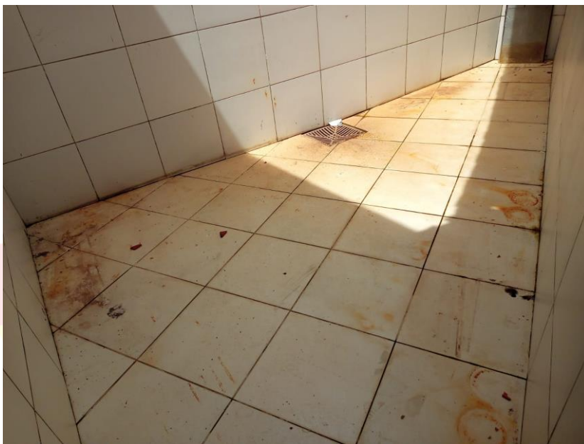
Foto 05. Defesa Civil Municipal dia 26/04/2022. Imagem interna depois da subida da maré às 11:55min.

EMAIL- secmeioambientevtm@gmail.com / defesacivilpmvtm@gmail.com