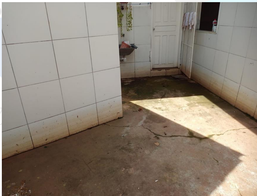
Foto 06. Defesa Civil Municipal dia 26/04/2022. Imagem interna depois da subida da maré às 11:56min.