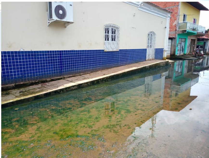
Foto 05. Defesa Civil Municipal dia 26/04/2022. Lateral junto a rua Coronel Gomes depois da subida da maré às 11:54min.