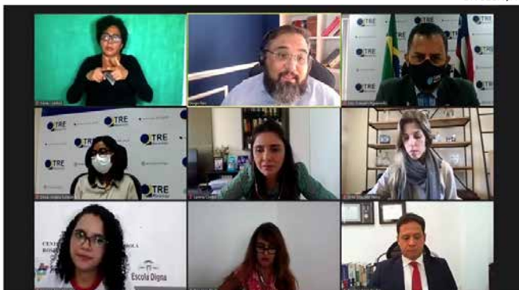
TRE-MA realizou diálogo sobre cidadania, democracia e inclusão

Lembrou que nos dias atuais as autoridades constituídas do Estado têm trazido fatos negativos acerca da urna eletrônica e é importante num evento como este dirigido aos jovens esclarecer para evitar notícias falsas. Falou da segurança e da confiabilidade da urna eletrônica que após sua implantação o processo ficou mais célere e ágil. Finalizou dizendo que todos os presidentes dos TREs se solidarizam e dão apoio irrestrito ao ministro Barroso pelo trabalho que vem desenvolvendo à frente do TSE, bem como aos juízes e servidores que desempenham suas atividades