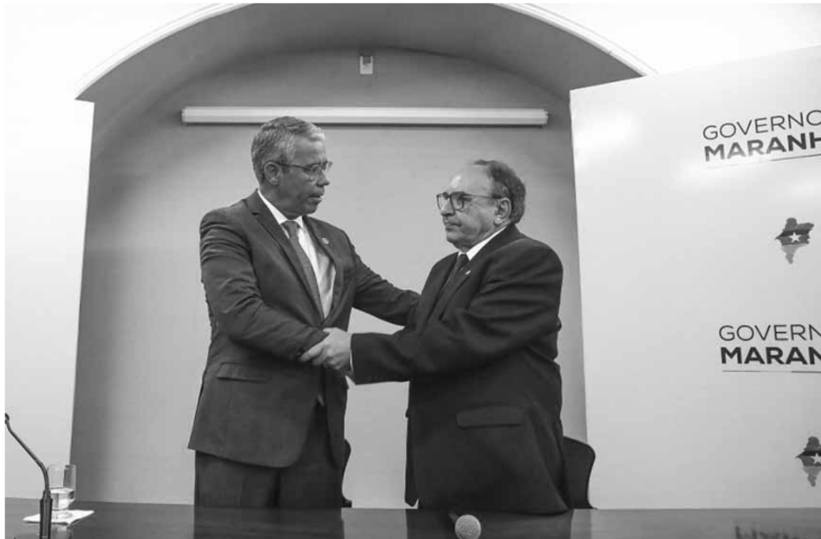
Governador Paulo Sérgio Velten e o chefe da Casa Civil, Sebastião Madeira

O ascenso do desembargador ao cargo de governador interino se deu, também, pela ausência do presidente da Assembleia Legislativa do Maranhão (Alema), Othelino Neto. Na oportunidade, o se-