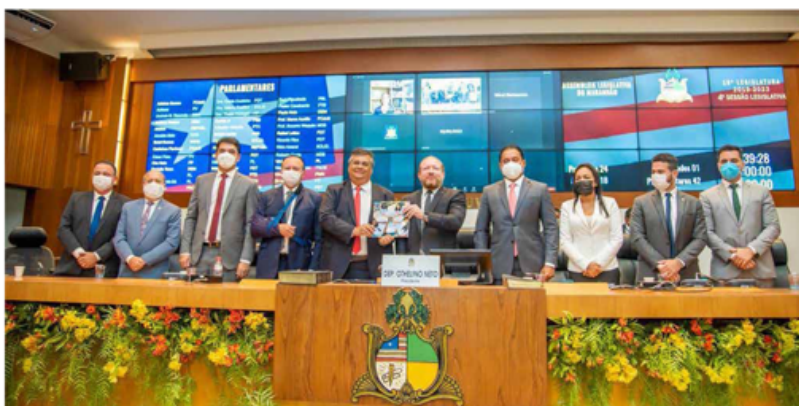
O governador Flávio Dino entrega Mensagem Governamental durante sessão solene, no plenário da Assembleia Legislativa