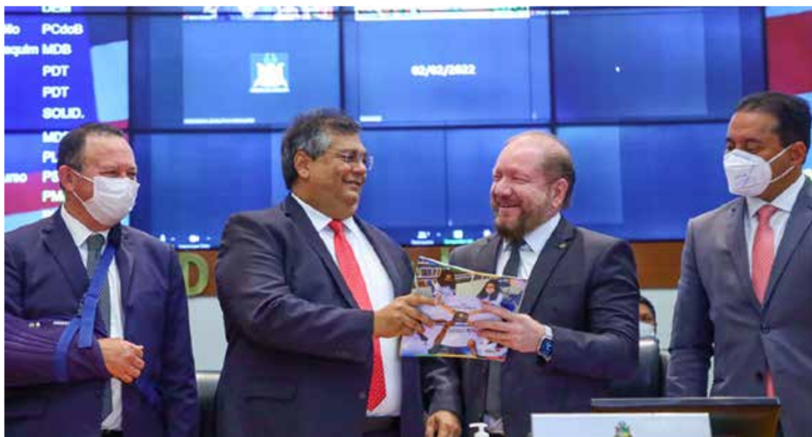
Flávio Dino entrega Mensagem Governamental durante sessão solene, no plenário da Assembleia

Othelino Neto destacou a importância da relação de equilíbrio, harmonia e independência entre os Poderes e entre os órgãos constitucionais. “É uma marca do Maranhão que nós temos que comemorar. Além de estar prevista na Constituição, essa relação é muito importante para a sociedade. Ver os Poderes