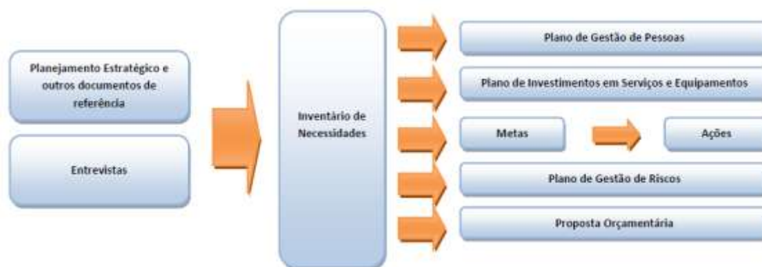
Figura 2 – Metodologia Aplicada para Elaboração do PDTIC

A metodologia na qual o projeto está embasado contém três fases: Preparação, Diagnóstico e Planejamento. A primeira fase da elaboração do PDTIC é a Preparação, na qual devem ser realizadas as tarefas necessárias para a criação de um plano de trabalho para elaboração do PDTIC. Após a aprovação do plano de trabalho, inicia-se a fase de diagnóstico, durante a qual serão identificadas a situação atual da TI e as necessidades a ser atendidas. A partir do diagnóstico deve-se fazer o planejamento. Para cada necessidade sugere-se estipular sua prioridade e uma ou mais metas e ações para seu atendimento. Estas ações podem envolver a contratação de serviços, a aquisição de equipamentos ou o uso de recursos próprios, inclusive humanos, para seu desenvolvimento.