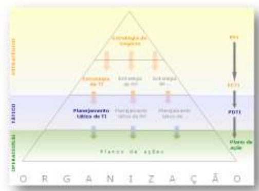
Figura 1 – Relação entre Planejamento Estratégico e PDTIC

A figura a seguir apresenta a relação entre o Planejamento Estratégico da organização e o PDTIC: