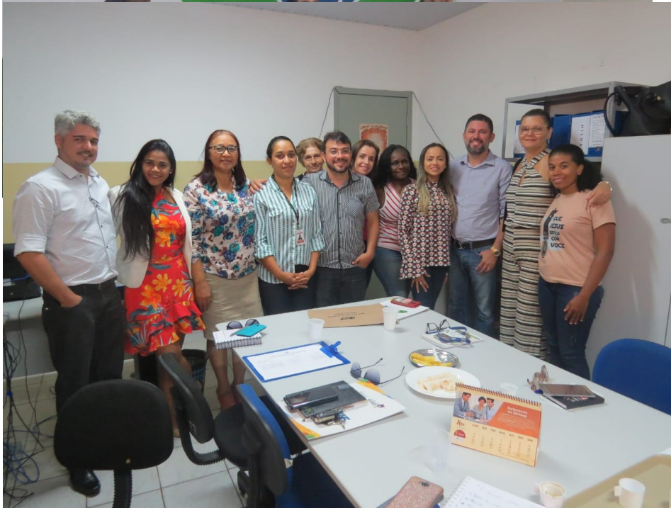
Mesa de encerramento da VII Semana de Execução Penal da Defensoria Pública