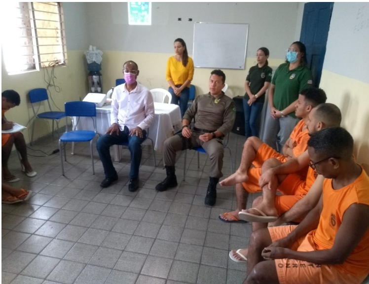
Unidade Prisional São Luís III – Manhã