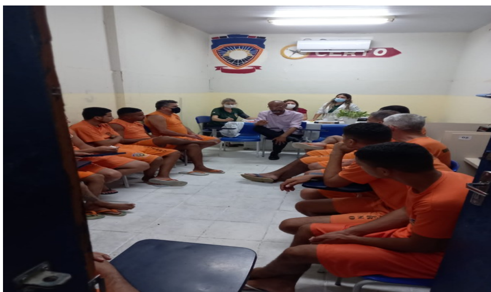
Unidade Prisional Olho D'Água