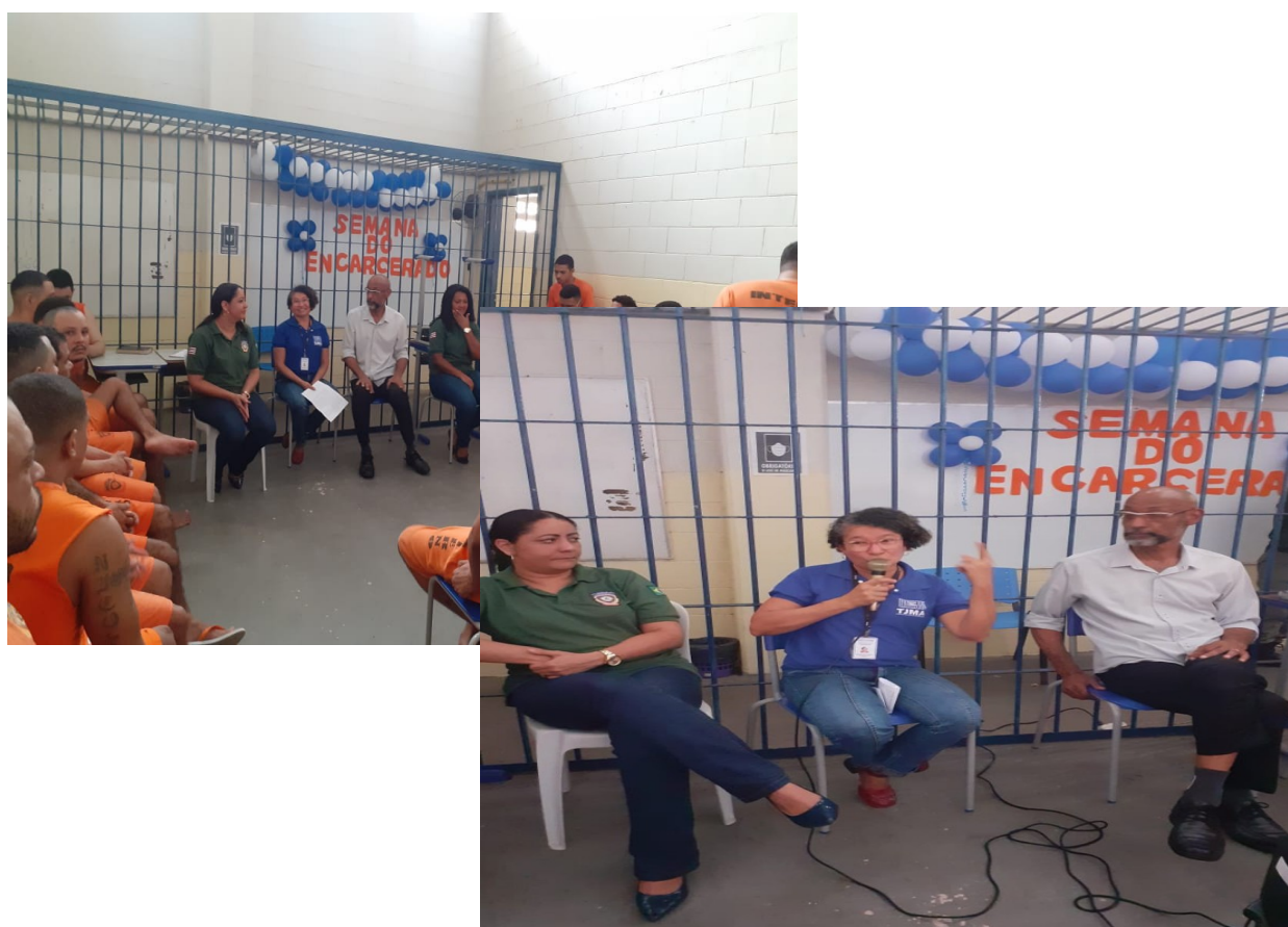
Unidade Prisional Regional – Pedrinhas