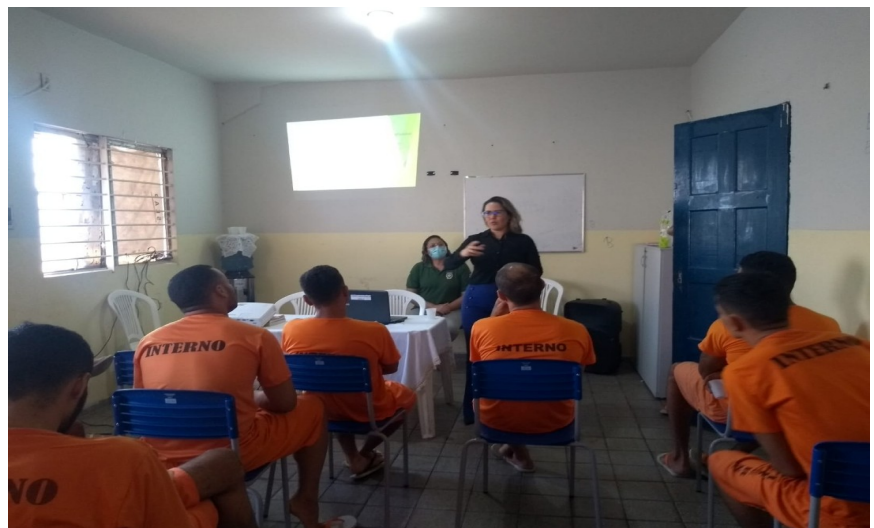
Unidade Prisional São Luís III – Tarde