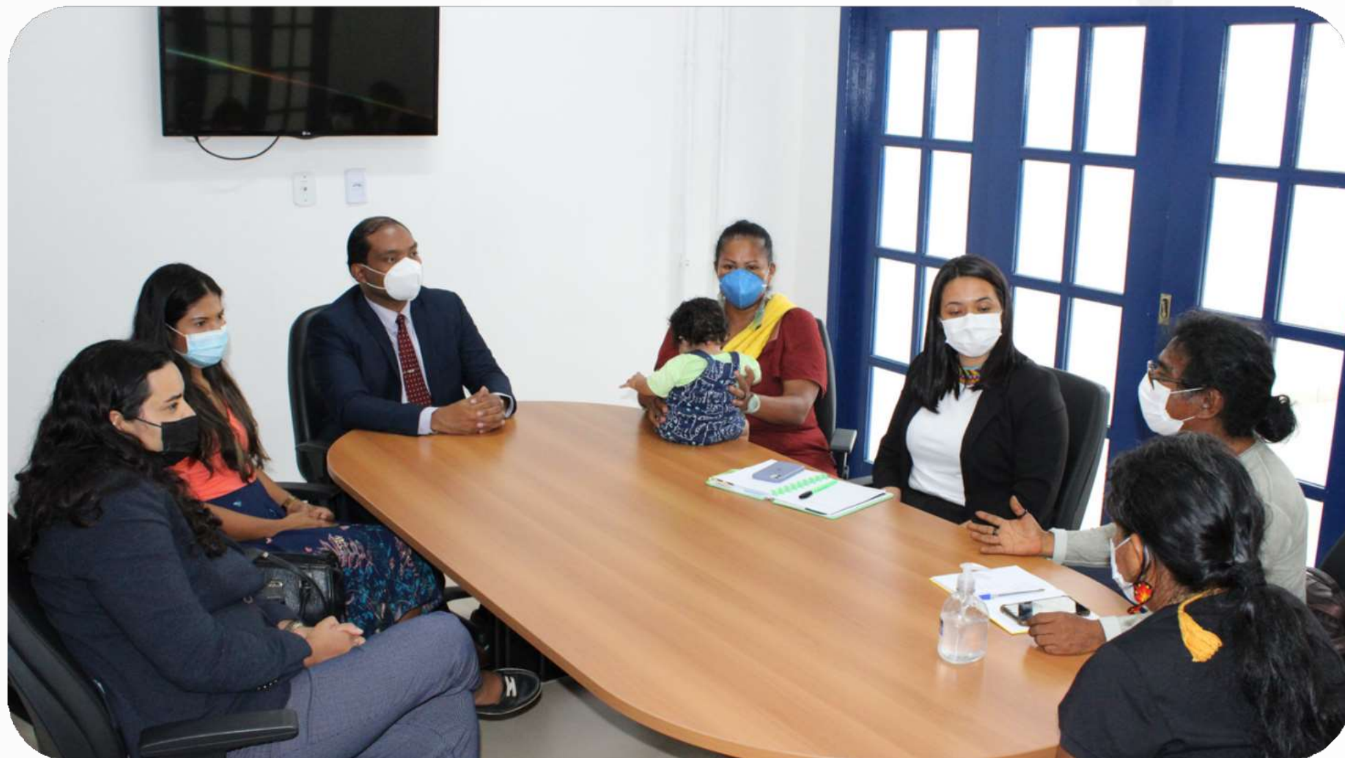
Foto: Reunião com lideranças indígenas no dia 15/02/2022