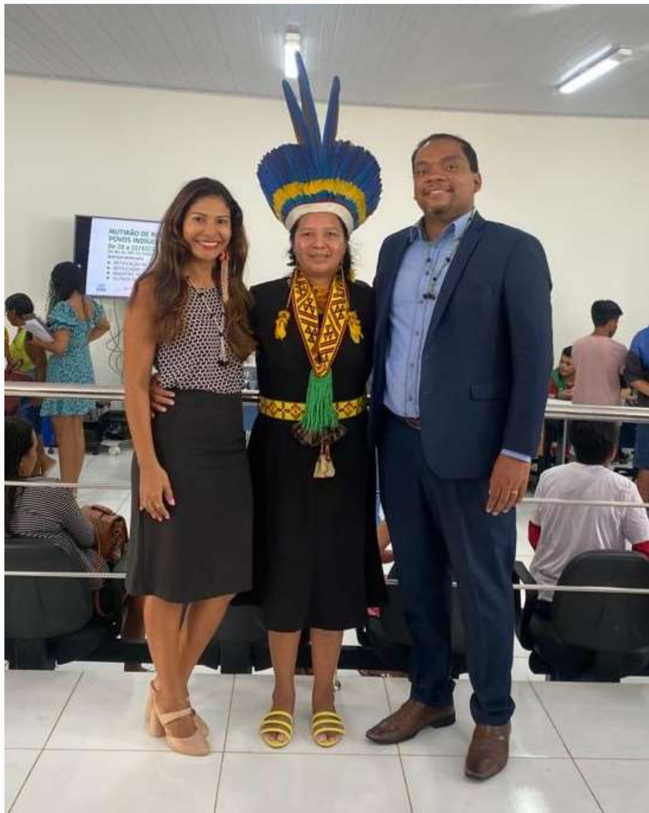
Cartório participante: Barra do Corda