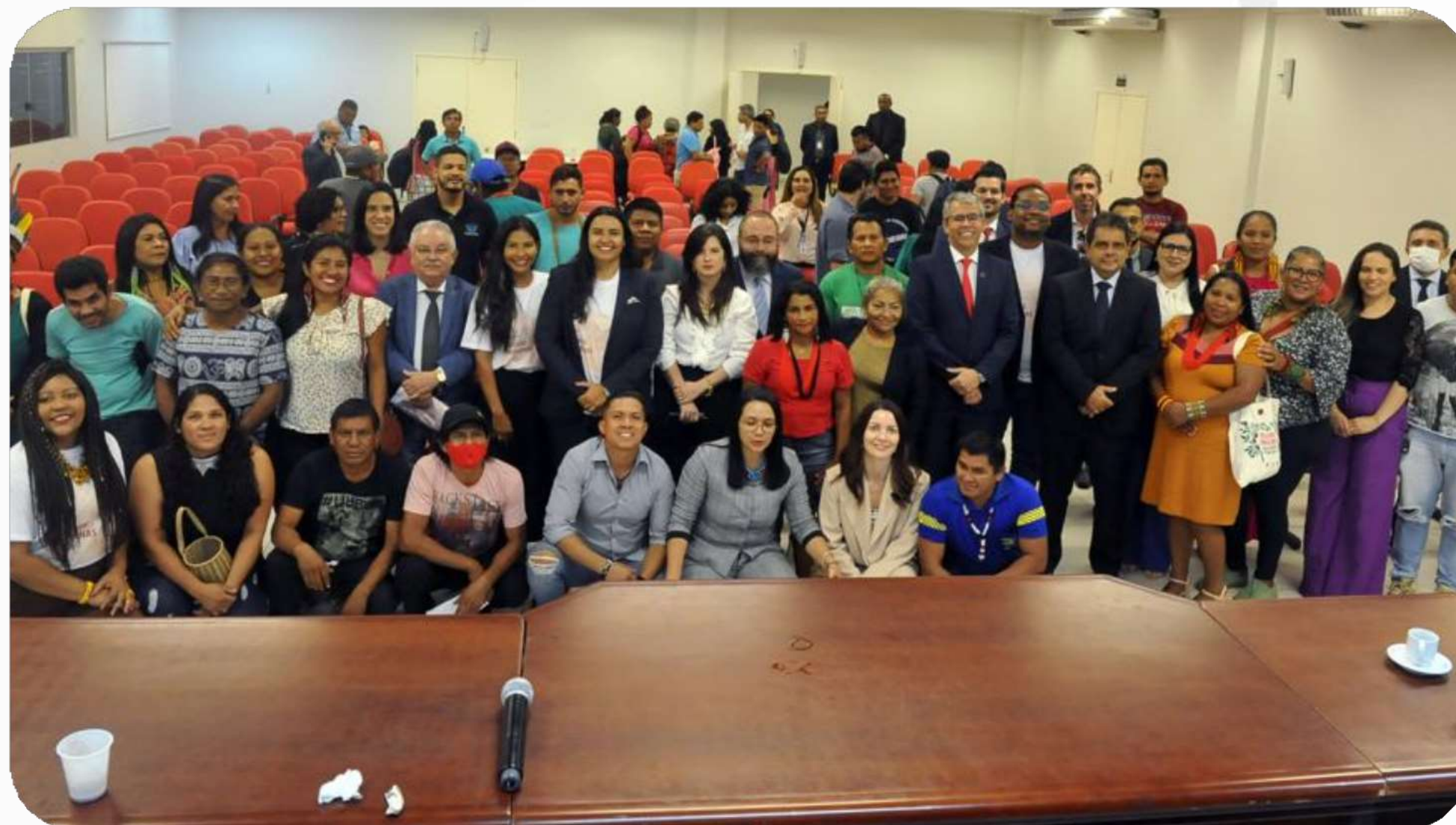
Foto: Audiência Pública de acesso aos Povos Indígenas

O encontro reuniu cerca de 100 pessoas no auditório "Dr. José Clebis dos Santos", na Subseção da OAB.