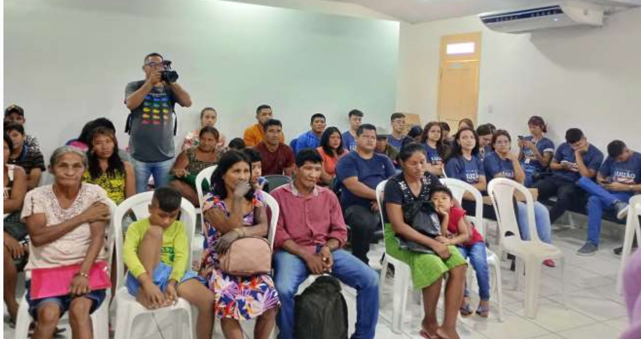
Cartório participante: Grajaú