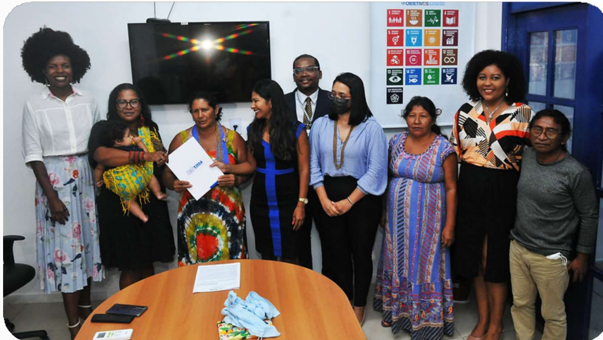
Foto: reunião de trabalho do dia 28/04/2022.