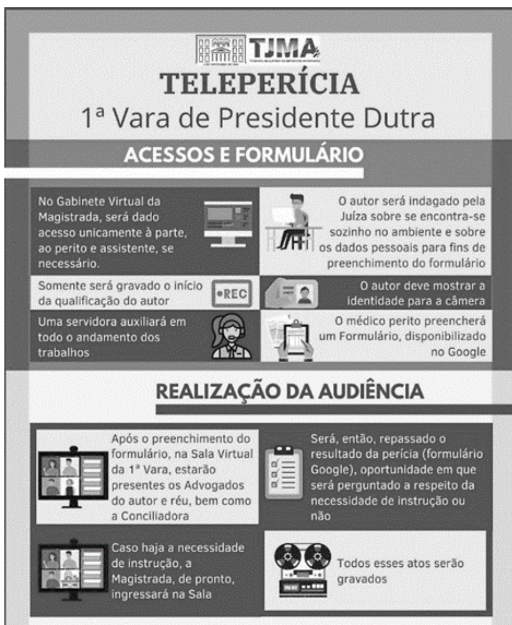
Figura 1: Informativo para Teleperícias

É claro que, embora a tecnologia tenha sido uma aliada na solução desses processos, o teste de conexão e também de acesso ao sistema de videoconferência se mostram necessários, até mesmo devido à não familiaridade com ingresso em salas virtuais, pelas partes. Por esse motivo, foi desenvolvida uma ilustração e anexada ao processo para fins de informação das partes envolvidas, demonstrado na figura 1 a seguir: