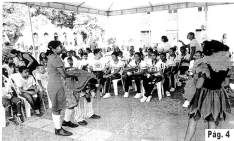
➡ Apresentação Enquete de Palhaços, da Casa da Acolhida Marista