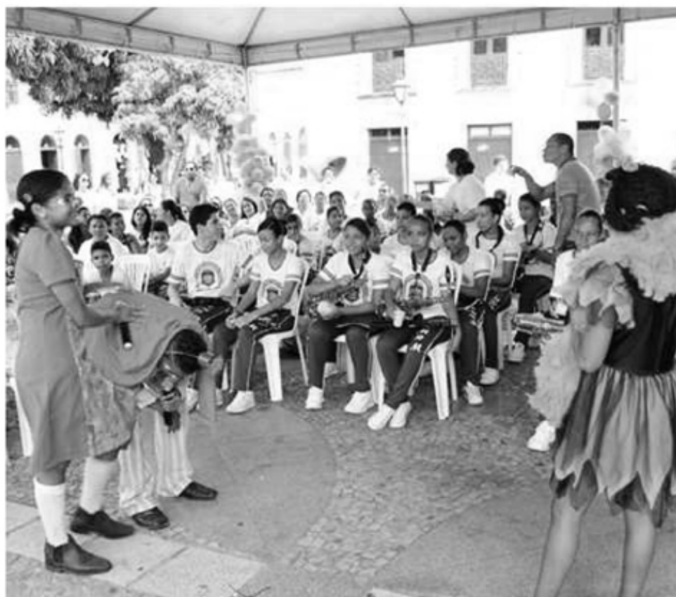
Apresentação da banda do Bom Menino, do Convento das Mercês

O evento contou com diversas apresentações culturais, ações de saúde e do projeto Ser Pai é Legal