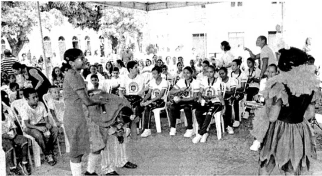
Apresentação Enquete de Palhaços, da Casa da Acolhida Marista

Centenas de crianças e adolescentes participaram da abertura da Semana da Criança realizada na Praça Nauro Machado (Praia Grande) nesta terça-feira (7). O evento, promovido pela Defensoria Pública do Estado (DPE/MA), em parceria com a Associação de Defensores Públicos do Estado (Adpema), contou com diversas apresentações culturais, ações de saúde e do projeto Ser Pai é Legal, realizado em parceria com a Federação das Indústrias do Estado do Maranhão (Fie-