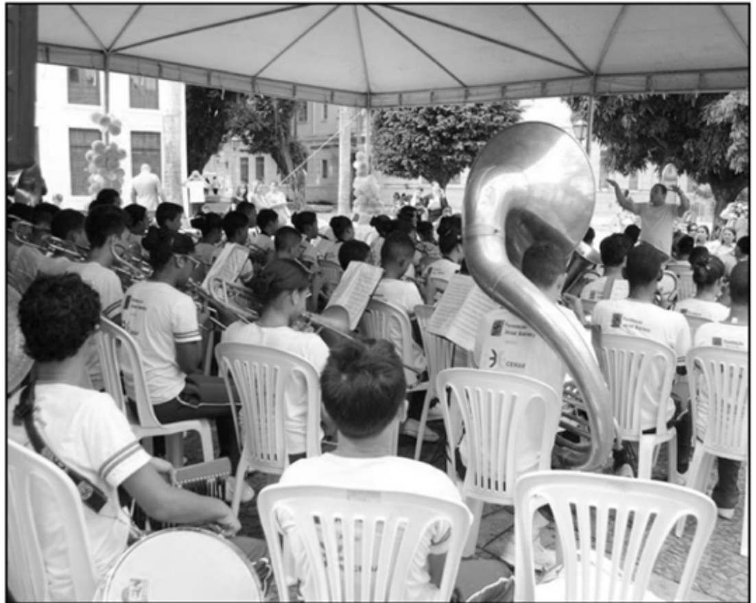
Apresentação da banda do Bom Menino, do Convento das Mercês

A Banda de Música do Bom Menino do Convento das Mercês fez a abertura oficial do evento. Na sequência, crianças e adultos acompanharam as apresentações da peça Enquete de Palhaços, da Casa da