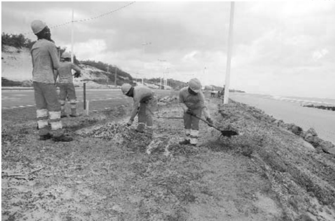
Operários trabalham na recuperação de calçamento do trecho prolongado da Av. Litorânea desde o dia 15 de setembro