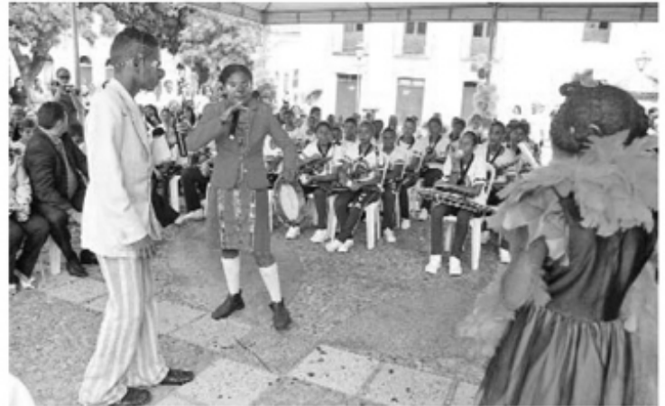
Encenação da peça Enquete de Palhaços, da casa da Acolhida Marista