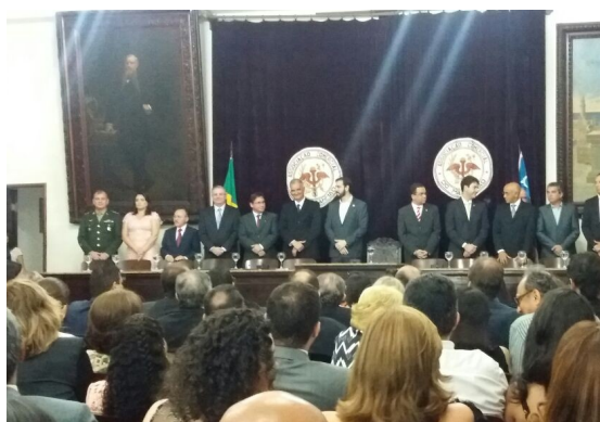
Aniversário de 163 anos da Associação Comercial do Maranhão, dia 30/08/2017.