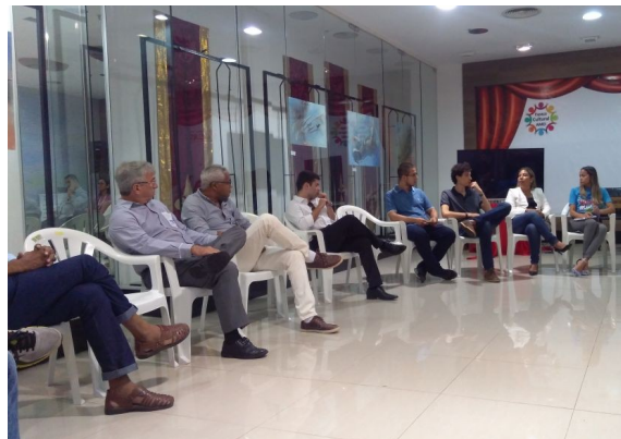
Roda de Conversa sobre os desafios da inserção dos egressos (as) no mercado de trabalho, dia 19/08/2017.