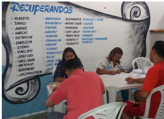
Ação de Documentação APAC – São Luís dia 16/08/2017.