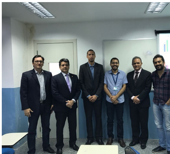
Reunião com Grupo de Modelagem de Sistemas Complexos, dia 31/08/2017