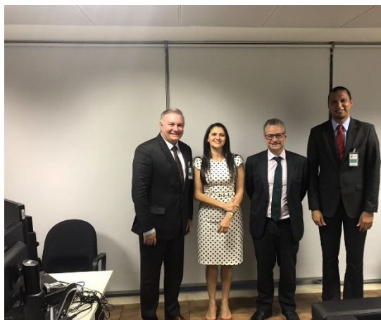
Reunião no CNJ dia 31/08/2017.