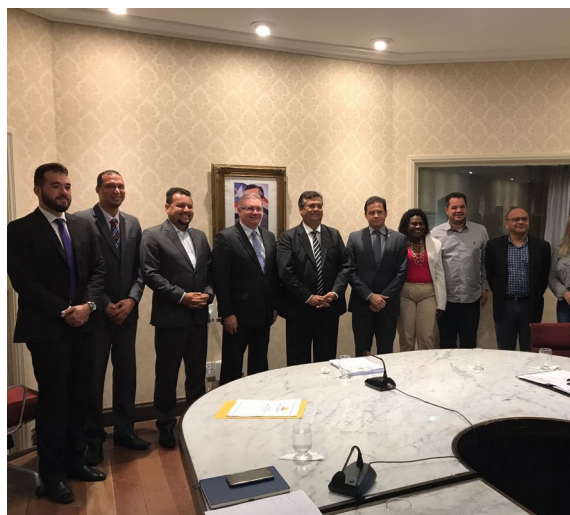
Reunião com o Governador Flávio Dino – Medidas Socioeducativas, dia 30/08/2017.