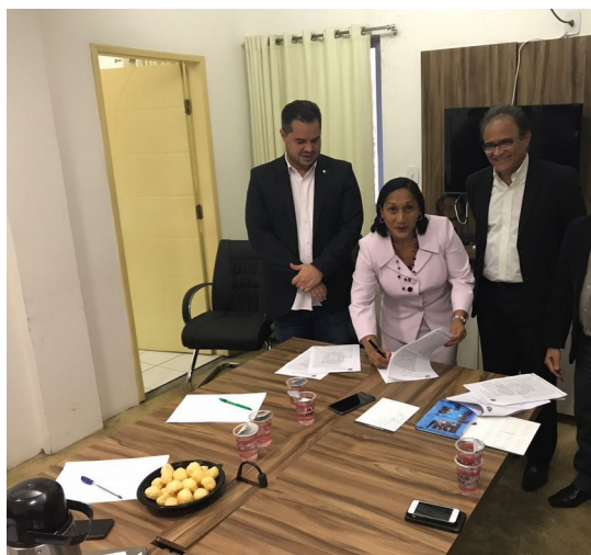
Assinatura do Termo de Acordo sobre a fábrica de pré- moldados na APAC São Luís, dia 17/08/2017.