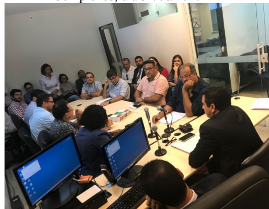
Reunião com as empresas responsáveis pelas obras das unidades de internação