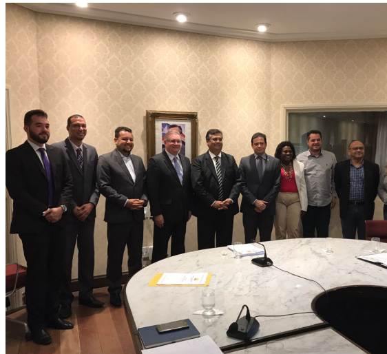
Reunião com o Governador Flávio Dino – Medidas Socioeducativas, dia 30/08/2017.