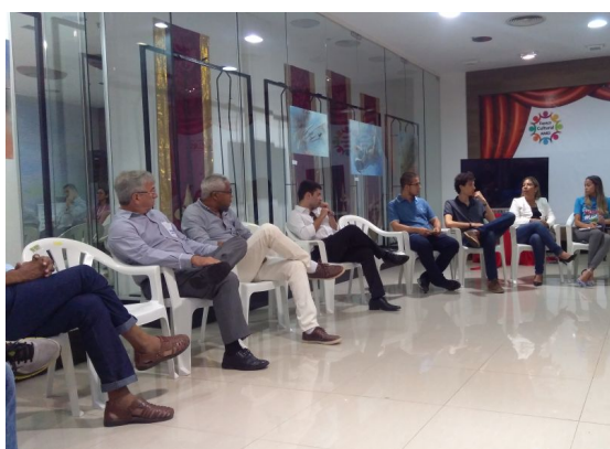
Roda de Conversa sobre os desafios da inserção dos egressos (as) no mercado de trabalho, dia 19/08/2017.