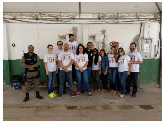
Ação de Cidadania – Projeto Identidade Cidadão do DEPEN