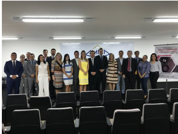
1º FOJUCEP – 06/10/2017