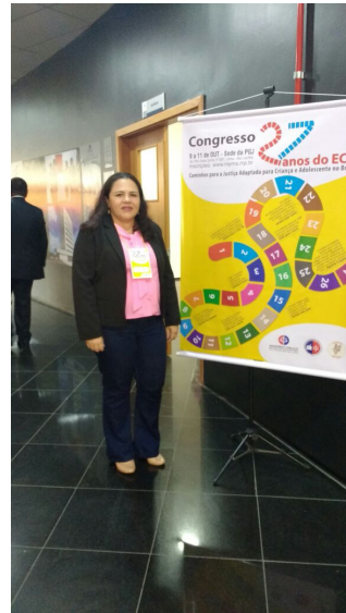
Congresso Caminhos para a Justiça – 08 a 11/10/2017