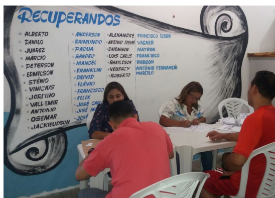
Ação de Documentação APAC – São Luís dia 16/08/2017.