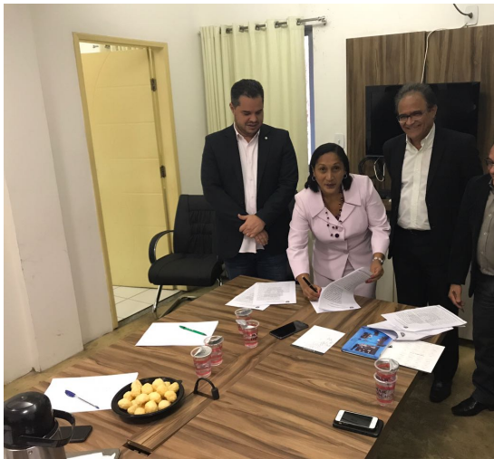
Assinatura do Termo de Acordo sobre a fábrica de pré- moldados na APAC São Luís, dia 17/08/2017.