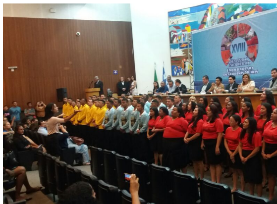
Abertura da XVIII Semana do Encarcerado, dia 19/08/2017.