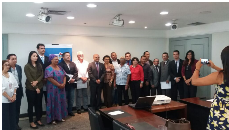
Posse dos membros no Comitê de Combate à Tortura – 31/10/2017