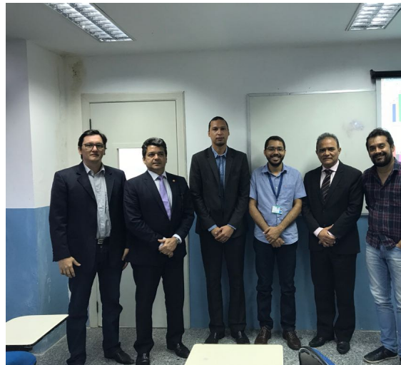
Reunião com Grupo de Modelagem de Sistemas Complexos, dia 31/08/2017