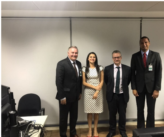
Reunião no CNJ dia 31/08/2017.