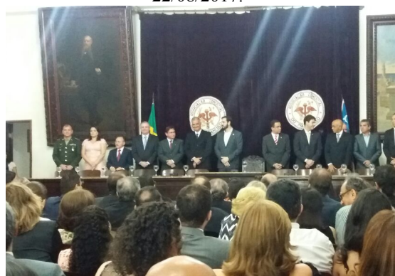
Aniversário de 163 anos da Associação Comercial do Maranhão, dia 30/08/2017.