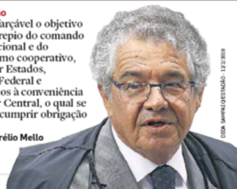
CELESTINO/ESTÁDIO - 12/2/2019

● Decisão “É indisfarçável o objetivo de, ao arrepio do comando constitucional e do federalismo cooperativo, submeter Estados, Distrito Federal e municípios à conveniência do Poder Central, o qual se recusa a cumprir obrigação criada.” Marco Aurélio Mello MINISTRO DO STF