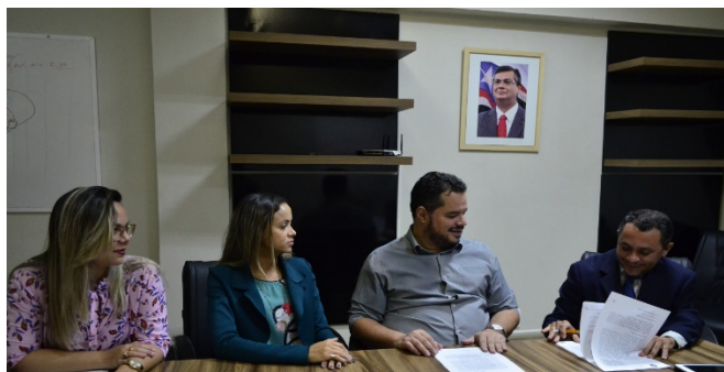
Assinatura do Termo de Colaboração entre APAC- São Luís e SEAP