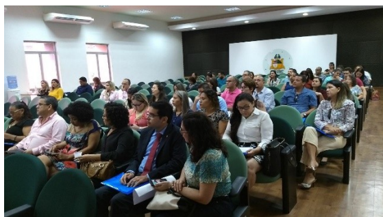
Seminário de Justiça e Saúde Mental – 26/03/2018