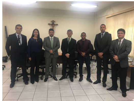
Reunião sobre Audiência de Custódia em Timon – 02/03/2018