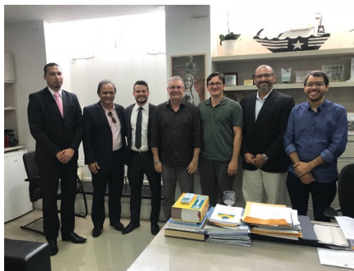
GT – Modelagem de Sistemas Complexos - 22/03/2018