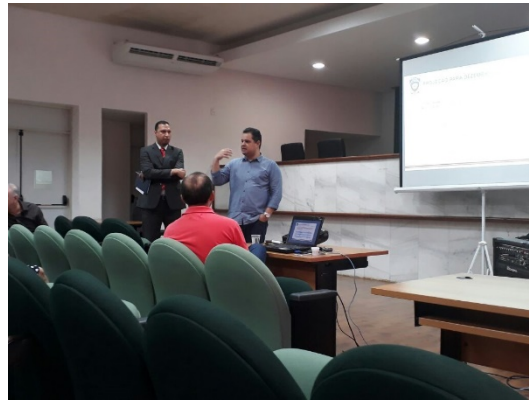
2ª Reunião do GMF – Apresentação do Planejamento de Novas Vagas para Unidades Prisionais em 2018 – 23/02/2018