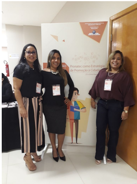
Capacitação Pronatec Prisional Depen – 27 e 28/03/2018