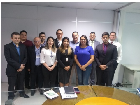
Reunião TRE – 18/04/2018