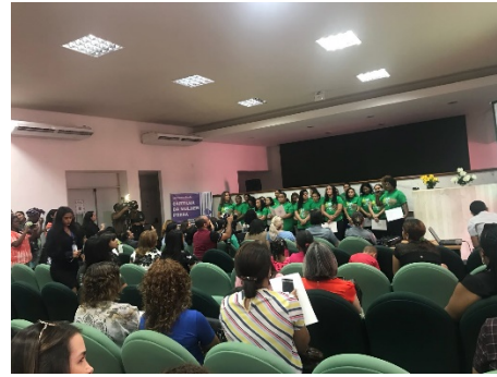
Lançamento da Cartilha da Mulher Presa – 27/03/2018