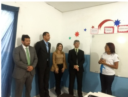
Visita à APAC – Timon – 02/03/2018