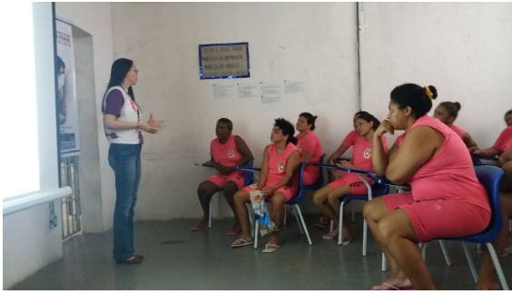
Cine Mulher – 21/03/2018