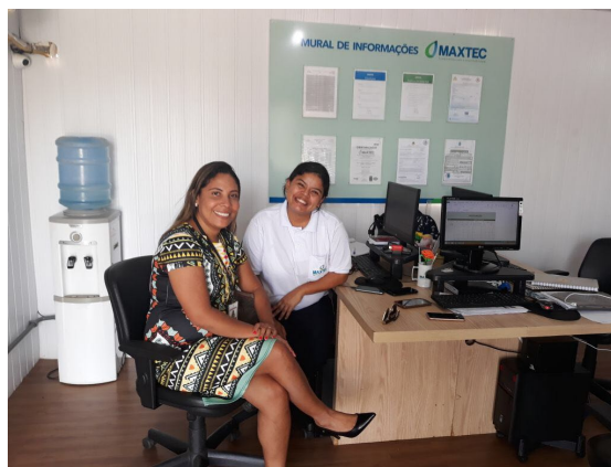
Reunião para acompanhamento de trabalhadores contratados através de parceria com o PCN –

Fonte: Relatório Mensal UMF – Maio/2018.