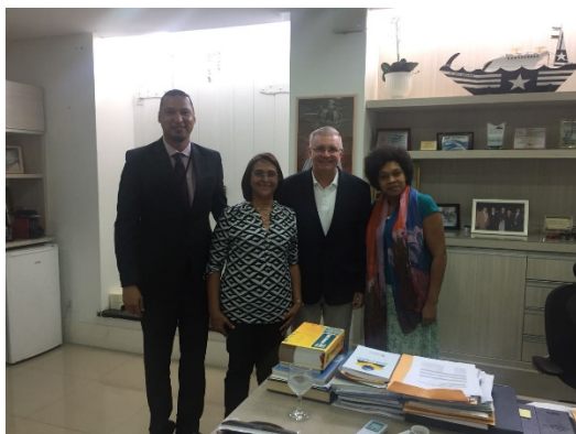
Reunião com a Secretaria da Mulher – SEMU – 13/03/2018