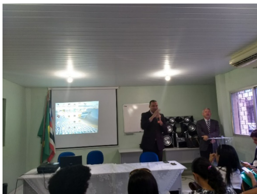
Seminário de Saúde Mental de Pessoas em Conflito com a Lei – 13/03/2018