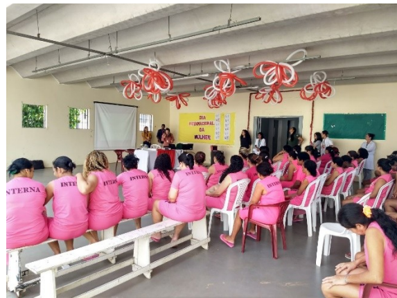
Palestra “O habeas corpus coletivo e suas consequências” – 08/03/2018