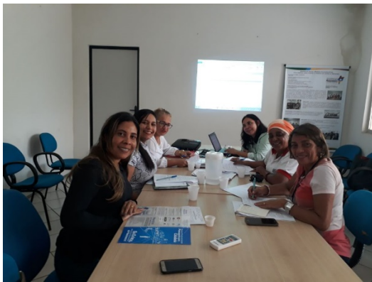
Reunião do comitê de Subregistro – 24/02/2018