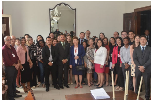
Homenagem aos servidores que trabalharam no mutirão do BNMP – 14/04/2018