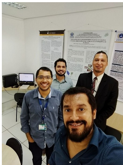
Reunião Grupo de Modelagem de Sistemas Complexos – 26/04/2018