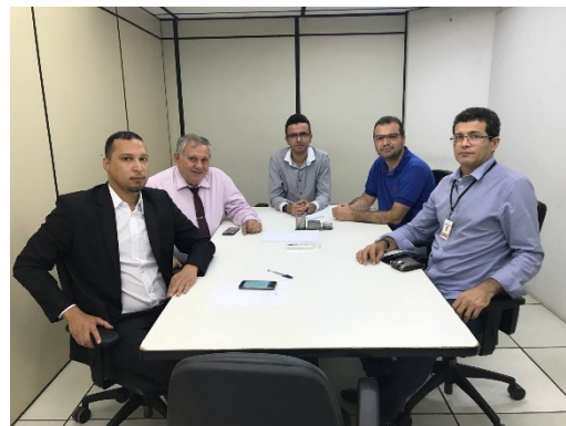
Reunião GT – Interoperabilidade – 13/03/2018