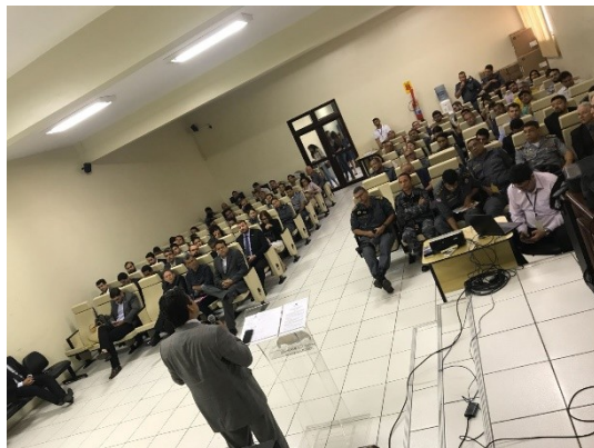
Workshop de Monitoração Eletrônica e Perícia Imperatriz – 20/02/2018