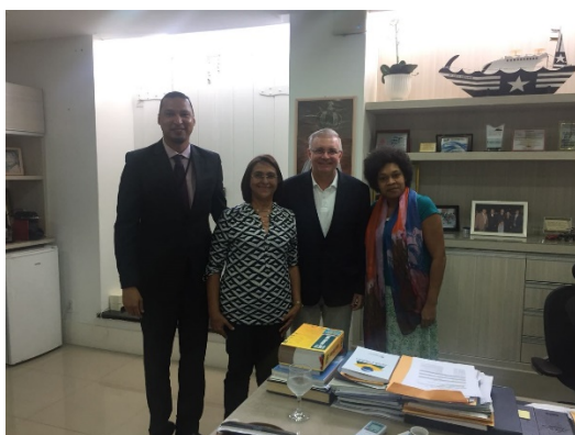
Reunião com a Secretária da Mulher – SEMU – 13/03/2018