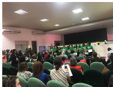
Lançamento da Cartilha da Mulher Presa – 27/03/2018