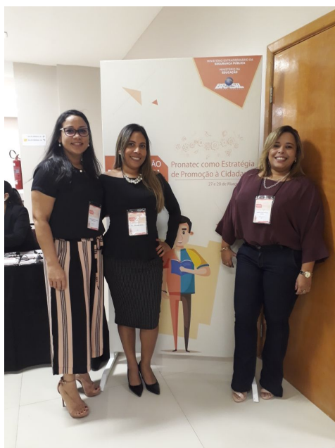
Capacitação Pronatec Prisional Depen – 27 e 28/03/2018