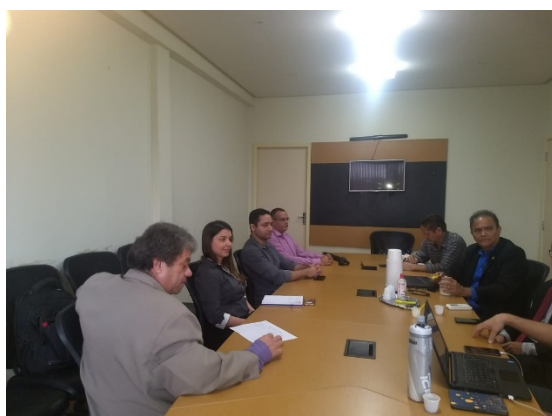
Reunião Observatório de Direitos Humanos do Maranhão – 19/06/2018