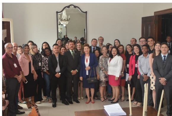
Homenagem aos servidores que trabalharam no mutirão do BNMP – 14/04/2018