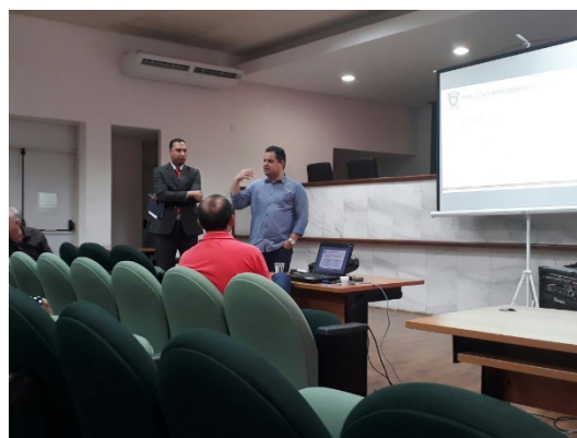
2ª Reunião do GMF – Apresentação do Planejamento de Novas Vagas para Unidades Prisionais em 2018 – 23/02/2018