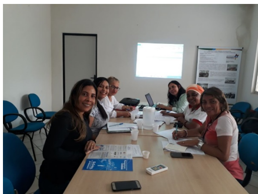
Reunião do comitê de Subregistro – 24/02/2018