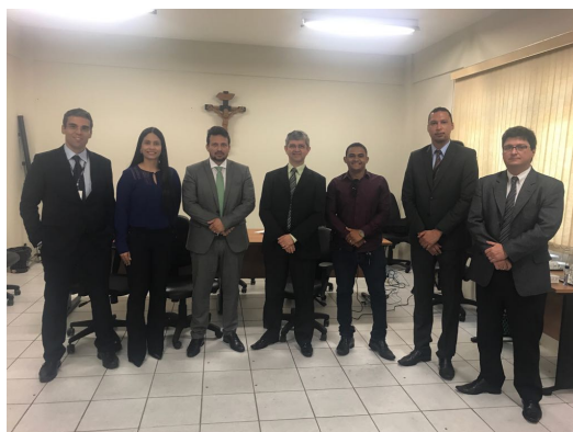
Reunião sobre Audiência de Custódia em Timon – 02/03/2018