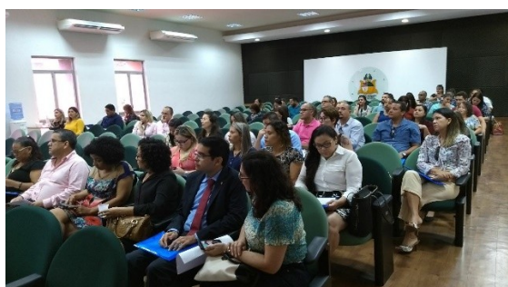
Seminário de Justiça e Saúde Mental – 26/03/2018