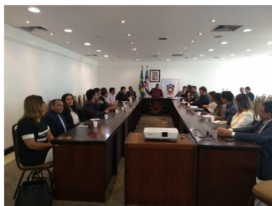
Reunião do Conselho Nacional de Política Penitenciária – CNPCP – 20/06/2018