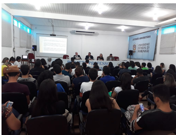
Palestra Ministrada pelo Des. Froz Sobrinho: O Sistema de garantias da Justiça Criminal no Brasil/ UEMA – 07/06/2018