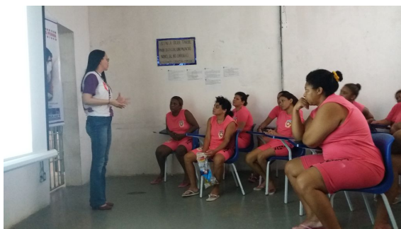
Cine Mulher – 21/03/2018