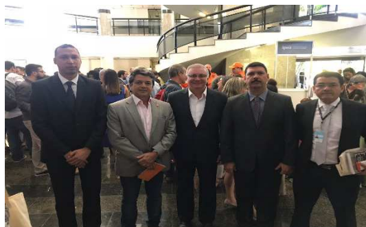
Fórum Brasileiro de Segurança Pública Brasília/DF – 21/08/2018