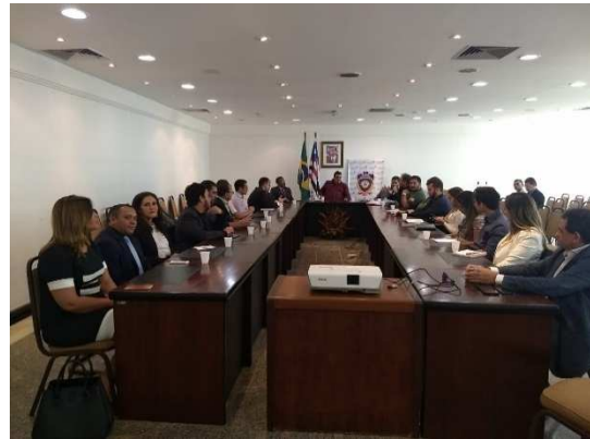
Reunião do Conselho Nacional de Política Penitenciária – CNPCP – 20/06/2018