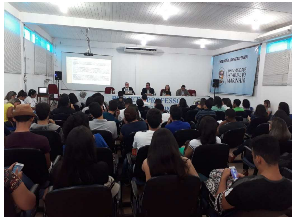
Palestra Ministrada pelo Des. Froz Sobrinho: O Sistema de garantias da Justiça Criminal no Brasil/ UEMA – 07/06/2018