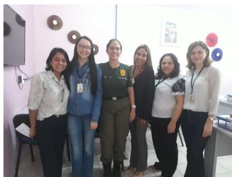
Reunião entre UMF/TJMA, Coord da Mulher em Situação de Violência Doméstica e Diretora de Atendimento e Humanização da UPFEM – 25/10/2018