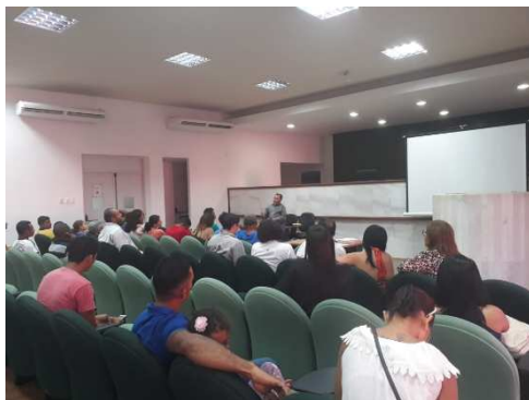
Cerimônia de Concessão de Livramento Condicional – 24/09/2018