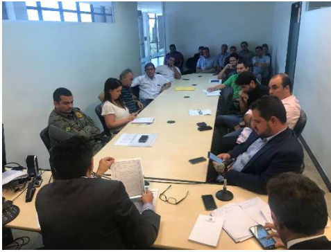
Reunião Grupo de Trabalho Construção de Presídios – 10/08/2018