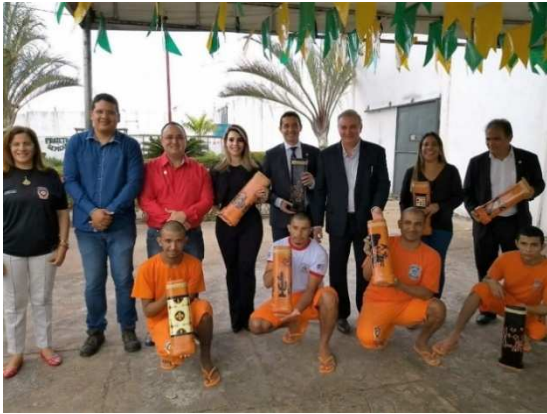
Visita à UPR – Itapecuru-Mirim – 03/07/2018