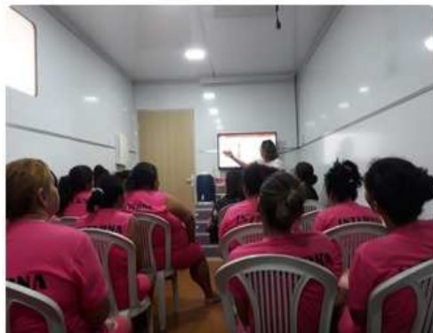
VII Semana de Execução Penal da Defensoria Pública – 17/10/2018