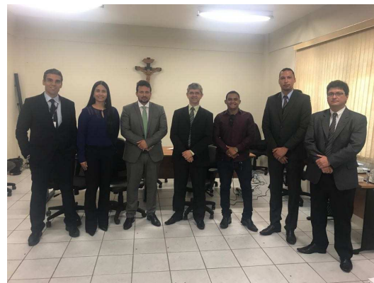
Reunião sobre Audiência de Custódia em Timon – 02/03/2018