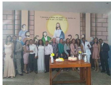
Cerimônia casamento coletivo - Apac de São Luís – 05/10/2018