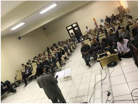
Workshop de Monitoração Eletrônica e Perícia Imperatriz – 20/02/2018