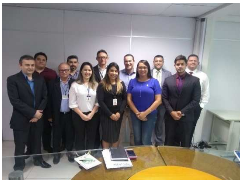
Reunião TRE – 18/04/2018