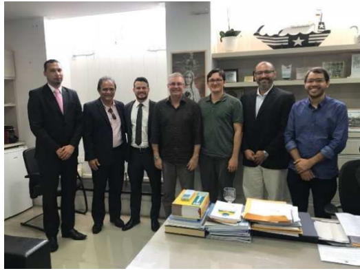
GT – Modelagem de Sistemas Complexos - 22/03/2018