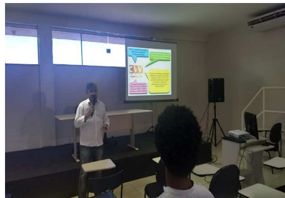
Reunião Centro de Valorização da Vida – 20/07/2018