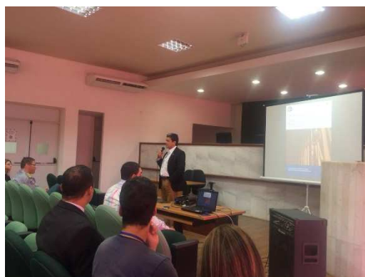
6ª Reunião do GMF – Auditório Administrativo TJMA – 21/09/2018