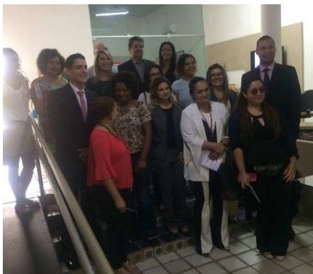
Reunião do GMF na Secretaria Estadual da Mulher – 31/08/2018