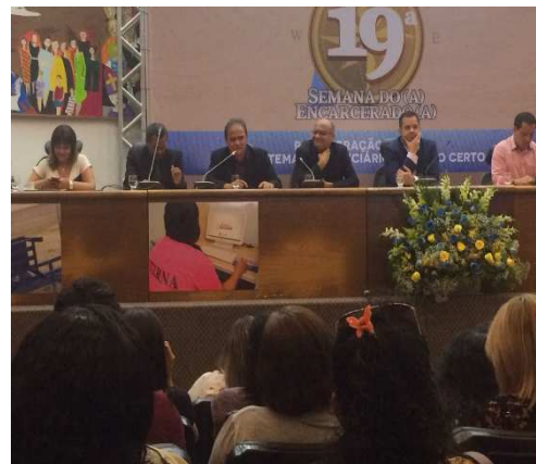
19ª Semana do Encarcerado – Imperatriz - MA – 17/08/2018