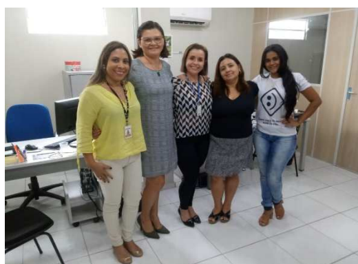
Reunião entre UMF/TJMA, SINE/SETRES e Reintegração da SEAP – 01/10/2018