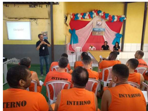
19ª Semana do Encarcerado – Apresentação Programa Começar de Novo - São Luis/MA – 22/08/2018