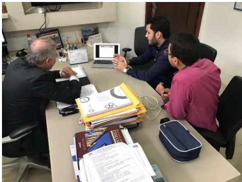
Reunião Grupo de Modelagem de Sistemas Complexos – Gabinete Des. Froz – 28/08/2018