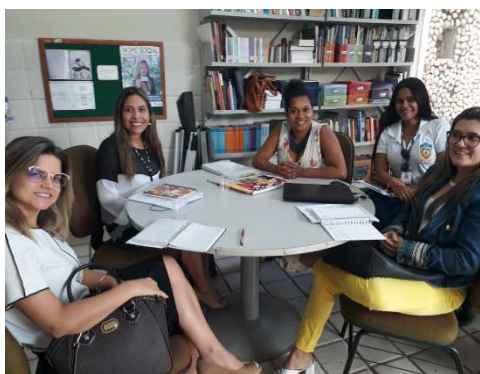
Reunião entre UMF/TJMA e Secretaria Estadual da Mulher – 13/09/2018