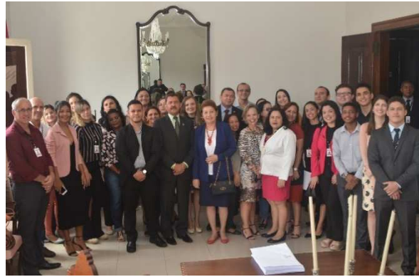
Homenagem aos servidores que trabalharam no mutirão do BNMP – 14/04/2018

Lançamento do Livro Direitos Humanos e Execução Penal: estudos em homenagem ao Des. Froz Sobrinho 28/04/2018