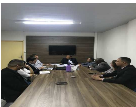
Reunião do Conselho Penitenciário do Estado – 28/09/2018