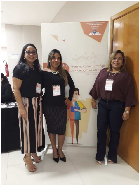
Capacitação Pronatec Prisional Depen – 27 e 28/03/2018