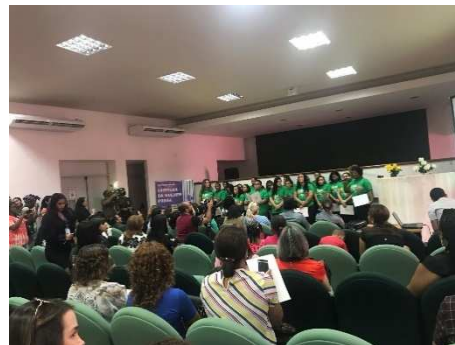
Lançamento da Cartilha da Mulher Presa – 27/03/2018