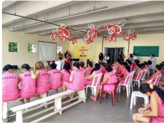
Palestra “O habeas corpus coletivo e suas consequências” – 08/03/2018