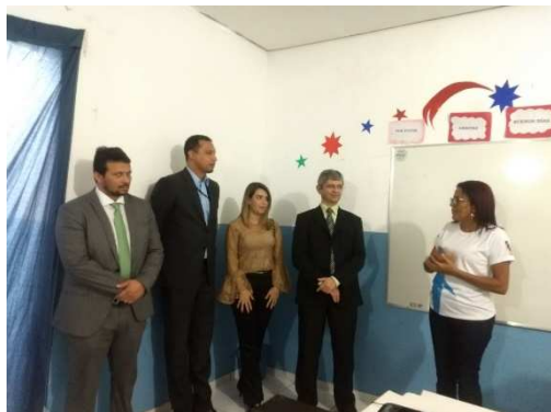
Visita à APAC – Timon – 02/03/2018