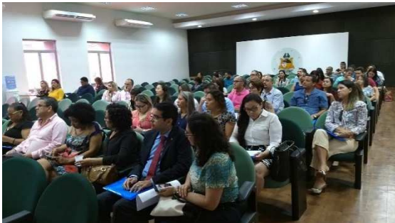
Seminário de Justiça e Saúde Mental – 26/03/2018