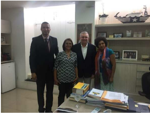
Reunião com a Secretaria da Mulher – SEMU – 13/03/2018