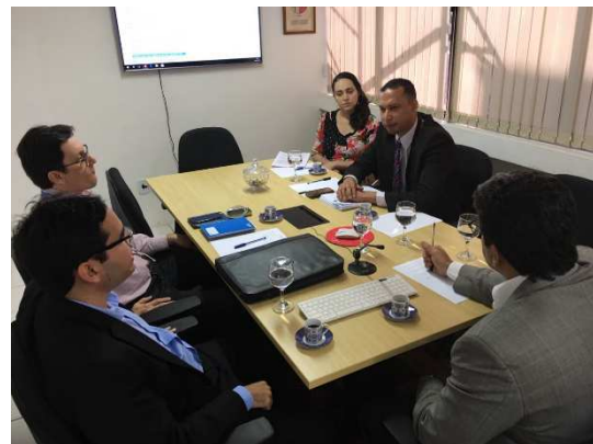
Reunião Observatório de Direitos Humanos – MPE/MA – 04/09/2018