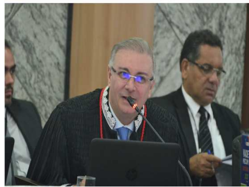
Participação do Des. Froz em Evento sobre Direito Constitucional em São Luís/MA – 18/09/2018