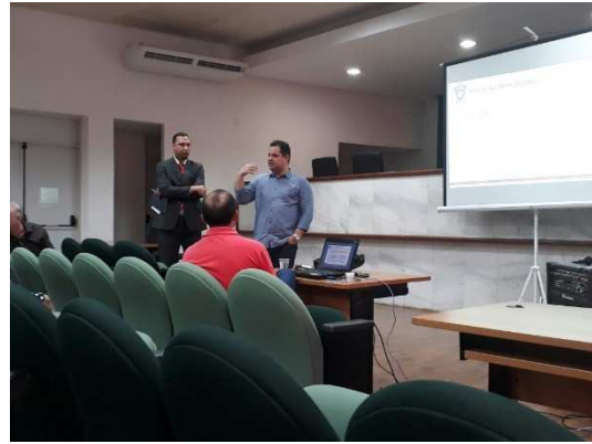
2ª Reunião do GMF – Apresentação do Planejamento de Novas Vagas para Unidades Prisionais em 2018 – 23/02/2018