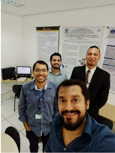
Reunião Grupo de Modelagem de Sistemas Complexos – 26/04/2018