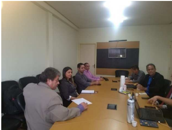
Reunião Observatório de Direitos Humanos do Maranhão – 19/06/2018