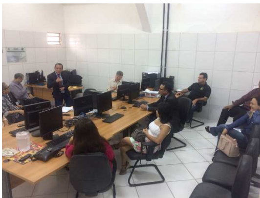
Reunião para Eleição da APAC – 20/07/2018