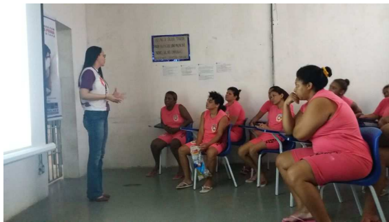
Cine Mulher – 21/03/2018