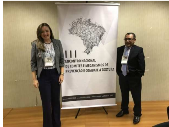
3º Encontro Nacional de Comitês e Mecanismos de Prevenção e Combate à Tortura – Brasília - DF – 04/07/2018