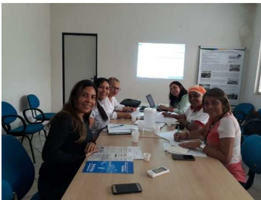
Reunião do comitê de Subregistro – 24/02/2018