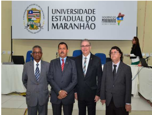
Sessão Itinerante 3ª Camara Criminal - UEMA – 17/09/2018