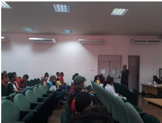
Cerimônia de Livramento Condicional – 30/07/2018