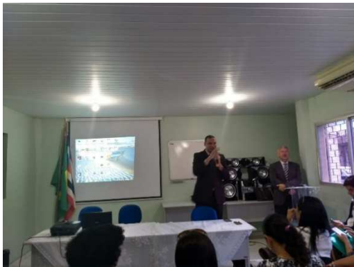
Seminário de Saúde Mental de Pessoas em Conflito com a Lei – 13/03/2018