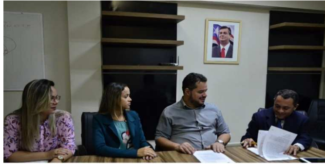
Assinatura do Termo de Colaboração entre APAC- São Luís e SEAP