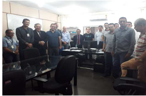
Reunião Grupo de Interoperabilidade – 14/08/2018