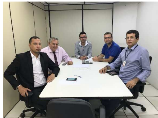
Reunião GT – Interoperabilidade – 13/03/2018