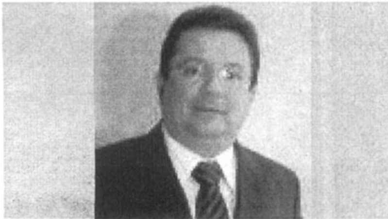
➡ Desembargador Jamil Gedeon

O desembargador Jamil Gedeon, presidente do Tribunal de Justiça do Maranhão, está respondendo pelo plantão do 2º grau desta segunda-feira, 27, até o dia 02 de janeiro de 2011. No período de 03 a 09 de janeiro o plantonista será o desembargador Guerreiro Júnior, corregedor-geral de Justiça.