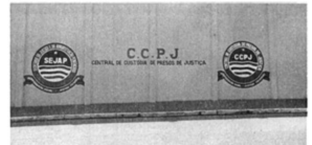
Diversas melhorias foram implantadas na Central de Custódia de Presos de Justiça do Anil