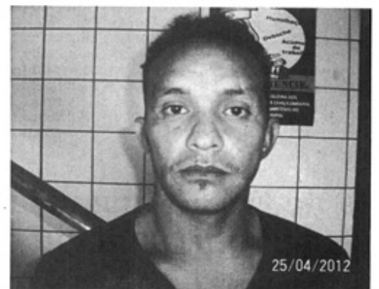
Suspeitos de cometer crimes capturados pelo SI-PM em São Luís

R$ 90 e uma bolsa com documentos pessoais.