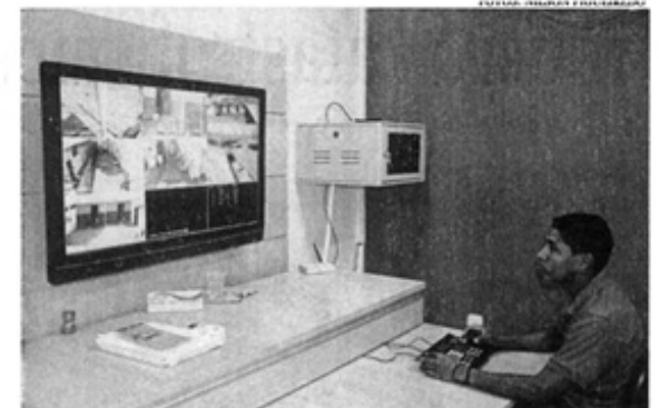
Sistema de monitoramento por circuito interno de TV foi instalado