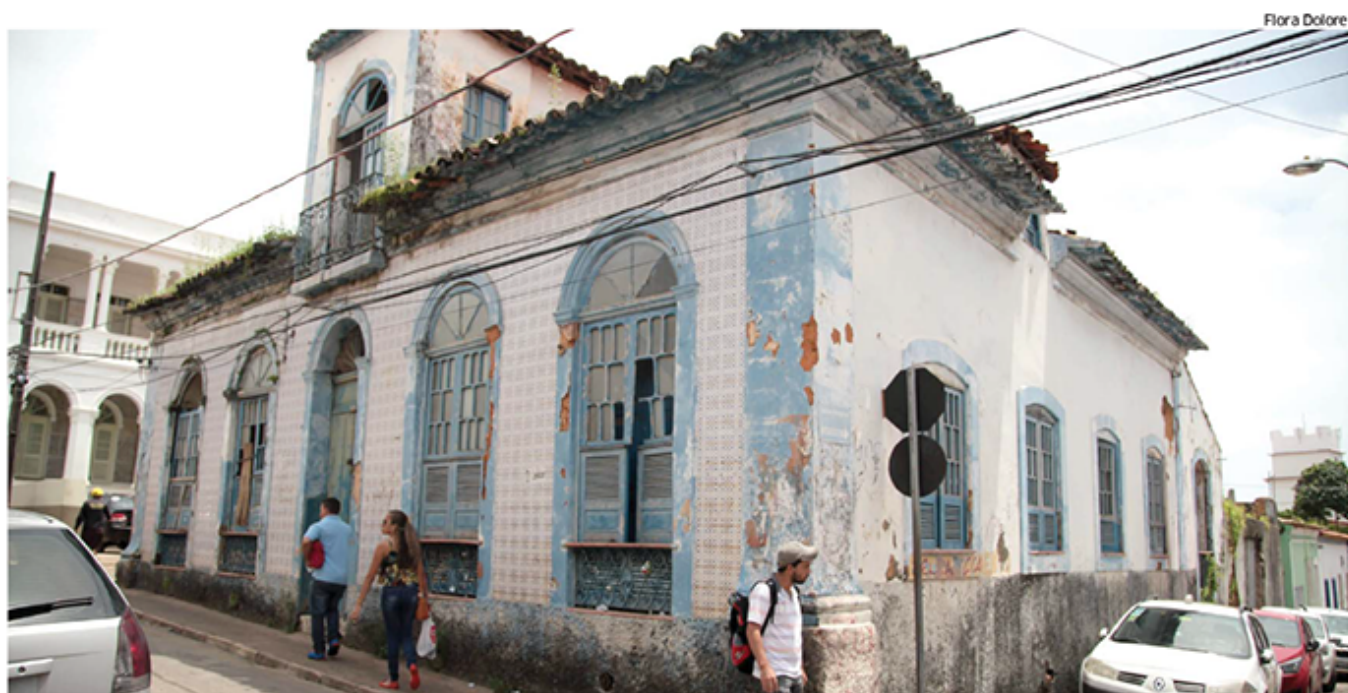
Casarão onde morou o autor de "O Mulato" está abandonado e, sem cuidados, pode até desabar; situação do imóvel é alvo de Ação Civil Pública