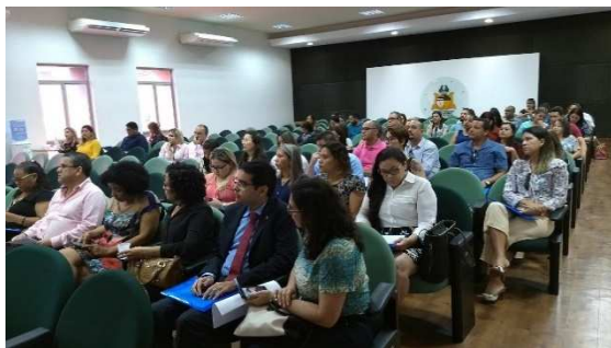
Seminário de Justiça e Saúde Mental – 26/03/2018