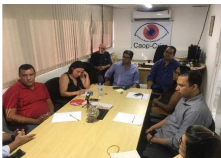
Reunião do Centro de Apoio Operacional Criminal - CAOP Criminal – 20/11/2018