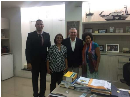
Reunião com a Secretaria da Mulher – SEMU – 13/03/2018