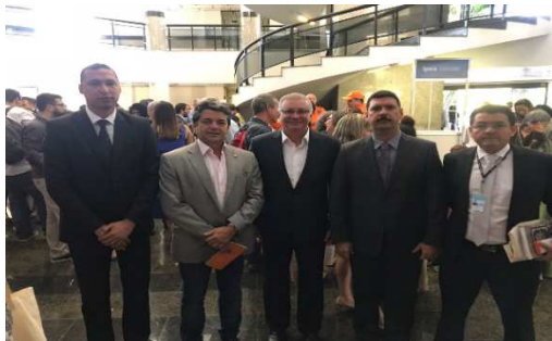
Fórum Brasileiro de Segurança Pública Brasília/DF – 21/08/2018