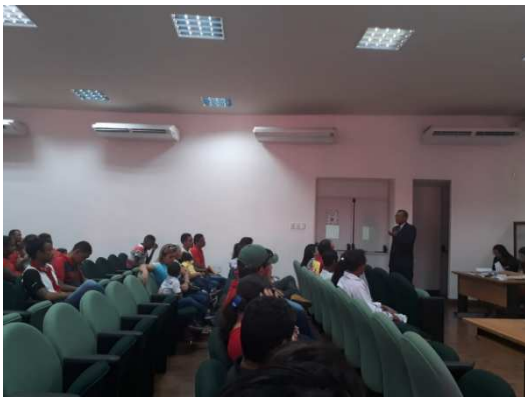
Cerimônia de Livramento Condicional – 30/07/2018