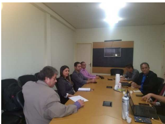
Reunião Observatório de Direitos Humanos do Maranhão – 19/06/2018