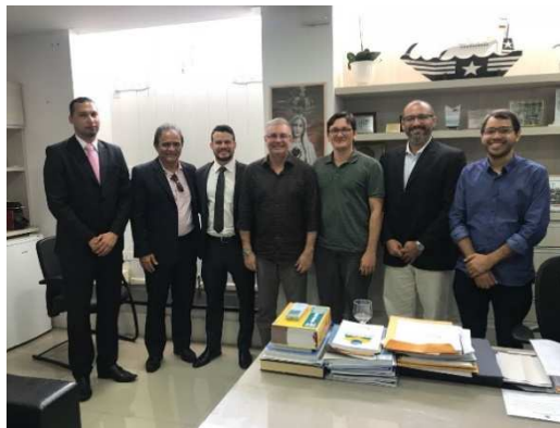
GT – Modelagem de Sistemas Complexos - 22/03/2018