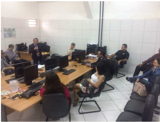
Reunião para Eleição da APAC – 20/07/2018