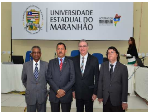
Sessão Itinerante 3ª Camara Criminal - UEMA – 17/09/2018