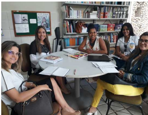
Reunião entre UMF/TJMA e Secretaria Estadual da Mulher – 13/09/2018