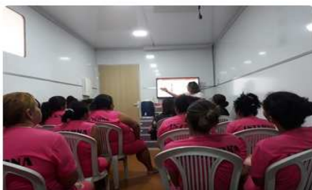
VII Semana de Execução Penal da Defensoria Pública – 17/10/2018