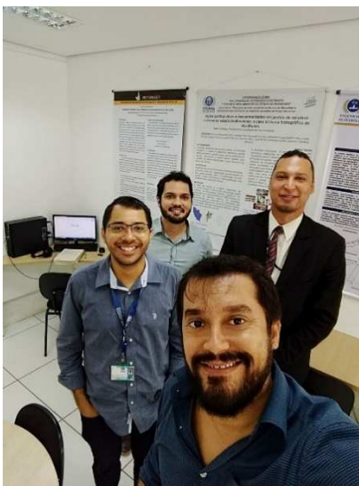
Reunião Grupo de Modelagem de Sistemas Complexos – 26/04/2018