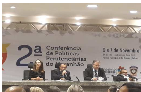
2ª Conferência de Políticas Penitenciária do Maranhão – 06/11/2018