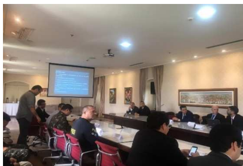
Reunião do Grupo de Interoperabilidade de Sistemas Criminais no Palácio dos Leões – 29/11/2018