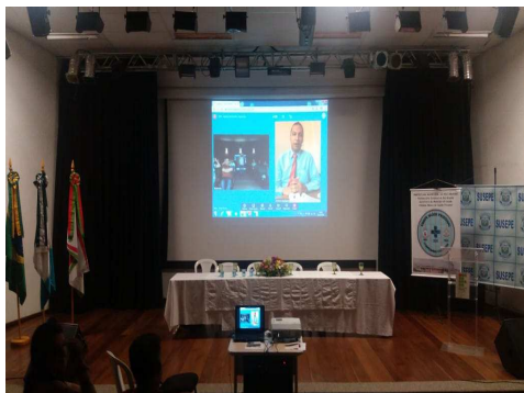
Participação Online da UMF/TJMA na Reunião do Observatório de Saúde do Trabalhador Prisional do Rio Grande do Sul – 13/11/2018