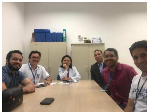
Reunião Grupo de Modelagem de Sistemas Complexos - 19/11/2018