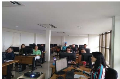
Mutirão de Cálculo de Pena na 1º Vara de Execuções Penais (UMF + SEAP) – 26/11/2018