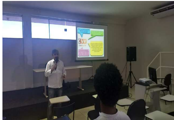
Reunião Centro de Valorização da Vida – 20/07/2018