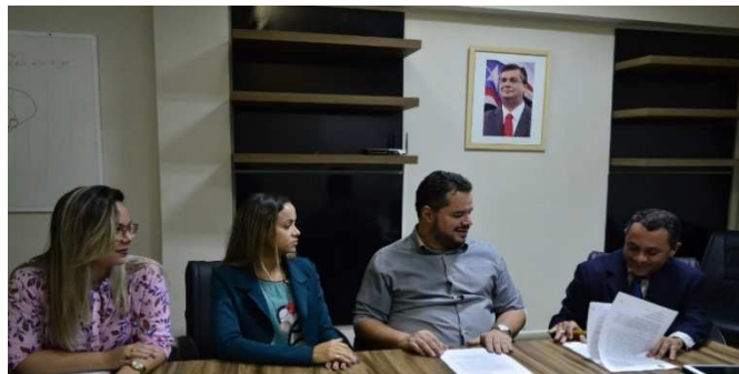
Assinatura do Termo de Colaboração entre APAC- São Luís e SEAP