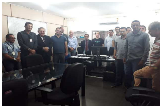
Reunião Grupo de Interoperabilidade – 14/08/2018