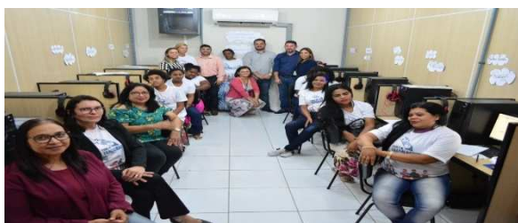
Aula inaugural do curso de cuidados de idosos para egressas e monitoradas acontecendo na Central de Reintegração Social-Seap (parceria entre a Setres, Seap e UMF Programa Começar de Novo) – 27/11/201