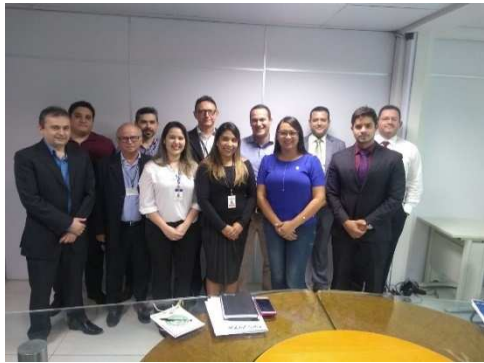
Reunião TRE – 18/04/2018