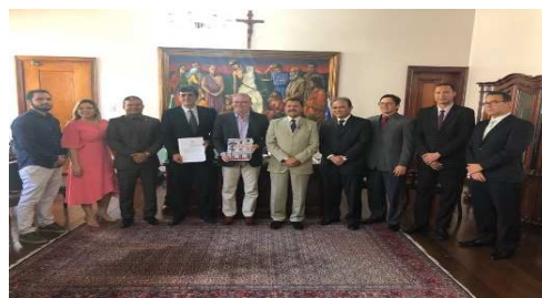
Termo de Acordo Assinado TJMA e CEUMA - Grupo de Modelagem de Sistemas Complexos aplicado a Políticas Prisionais e de Segurança Pública – 06/01/2018