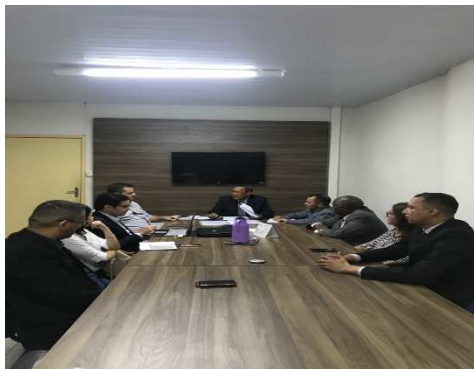
Reunião do Conselho Penitenciário do Estado – 28/09/2018