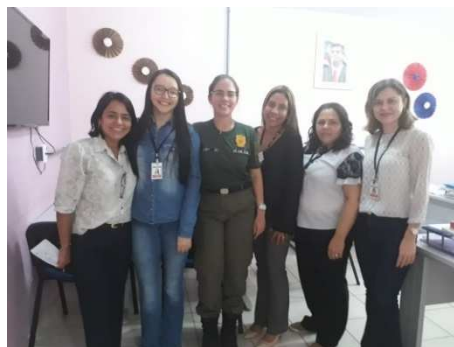
Reunião entre UMF/TJMA, Coord da Mulher e Diretora de Atendimento e Humanização da UPFEM – 25/10/2018