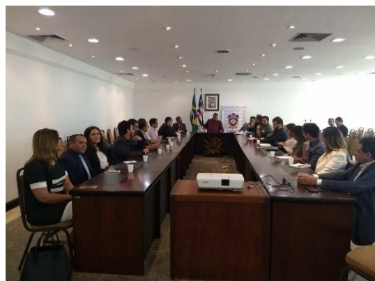
Reunião do Conselho Nacional de Política Penitenciária – CNPCP – 20/06/2018