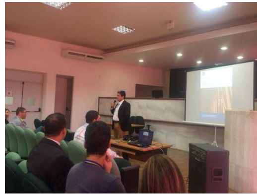
6ª Reunião do GMF – Auditório Administrativo TJMA – 21/09/2018