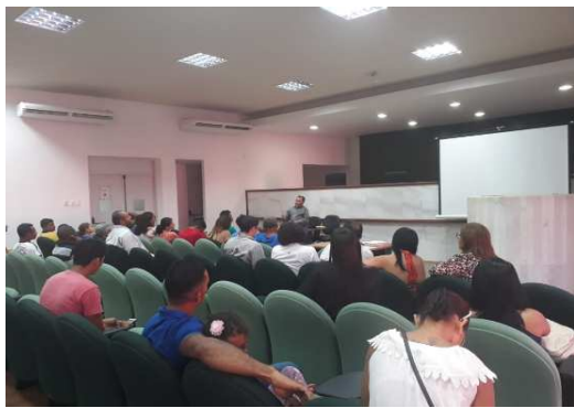
Cerimônia de Concessão de Livramento Condicional – 24/09/2018