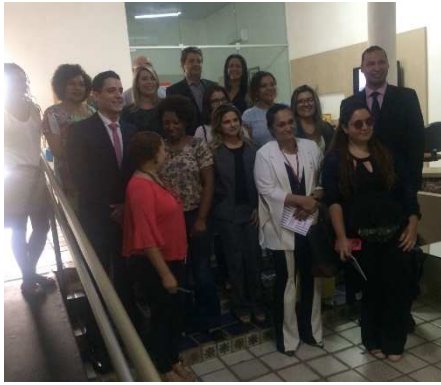
Reunião do GMF na Secretaria Estadual da Mulher – 31/08/2018