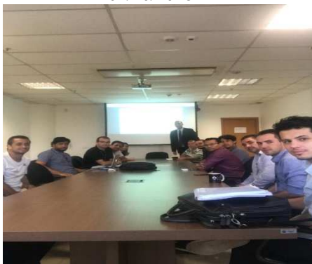
Reunião GT – Interoperabilidade – 01/11/2018