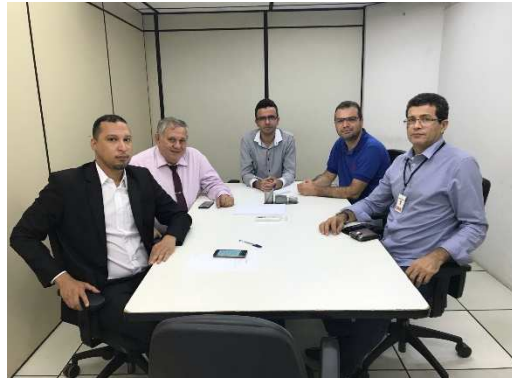
Reunião GT – Interoperabilidade – 13/03/2018