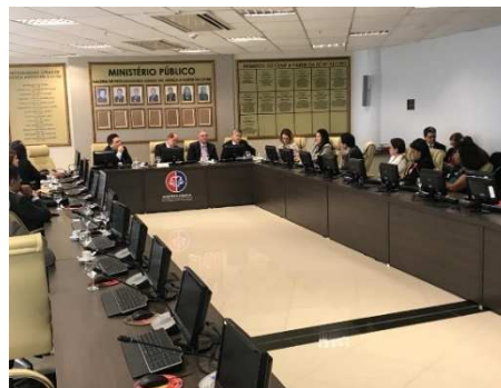
Reunião do TJMA com representantes da Organização dos Estados Americanos (OEA) – 08/11/2018