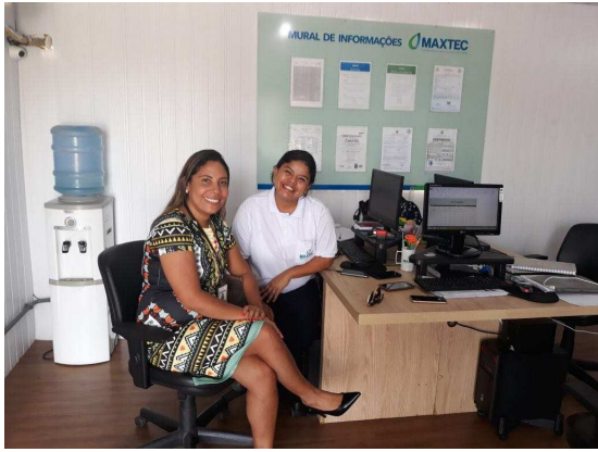
Reunião para acompanhamento de trabalhadores contratados através de parceria com o PCN – 09/01/2018