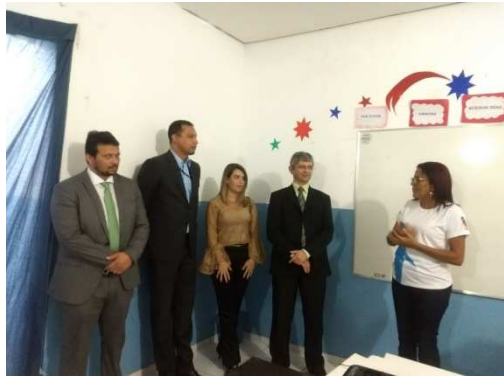
Visita à APAC – Timon – 02/03/2018