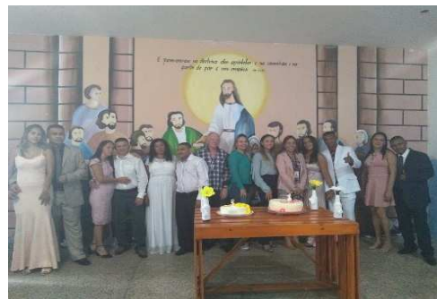
Cerimônia casamento coletivo - Apac de São Luís – 05/10/2018