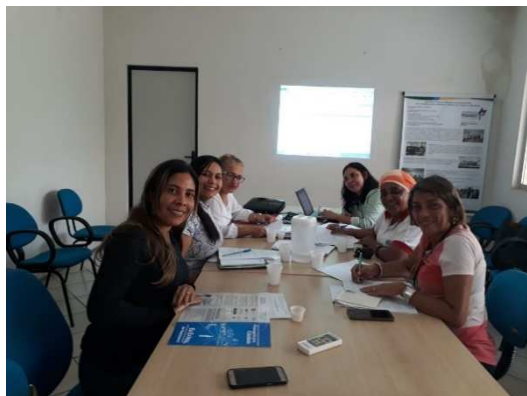
Reunião do comitê de Subregistro – 24/02/2018