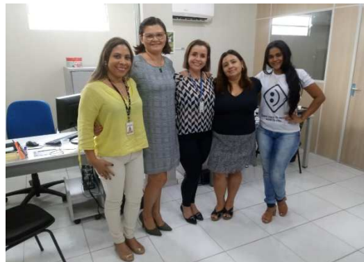
Reunião entre UMF/TJMA, SINE/SETRES e Reintegração da SEAP – 01/10/2018