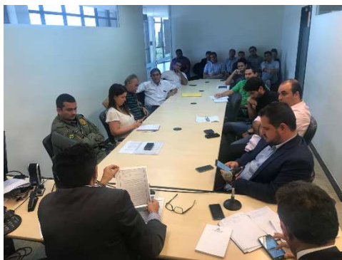
Reunião Grupo de Trabalho Construção de Presídios – 10/08/2018