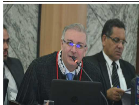
Participação do Des. Froz em Evento sobre Direito Constitucional em São Luís/MA – 18/09/2018