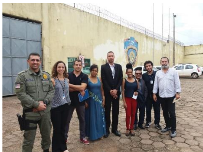
Visita da Equipe do PNUD/CNJ ao Complexo Penitenciário São Luis – 22/05/2019