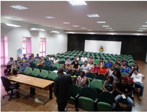
1ª Cerimônia de Livramento Condicional 2019 – 28/01/2019