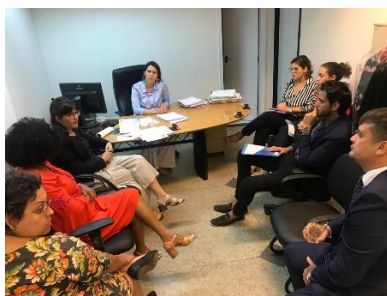
Visita da Equipe do PNUD/CNJ á Central de Inquéritos – 21/05/2019