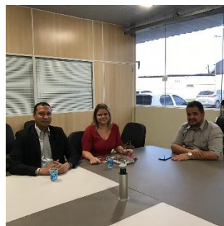
Reunião com a Juíza de Presidente Dutra – 31/05/2019