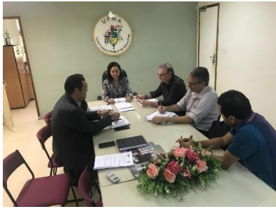
Reunião para tratar da pós em gestão Judiciária – 16/04/2019