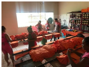
Visita da Equipe do PNUD/CNJ á malharia na Penitenciária feminina – 22/05/2019