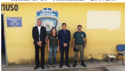
Inspeção na UPR de Santa Inês – 16/05/2019