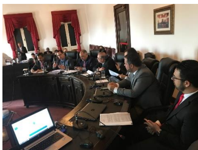
Apresentação do Programa Justiça Presenten – 20/05/2019