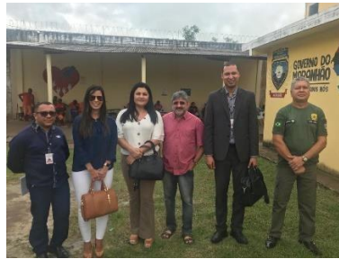
Inspeção na UPR de Bacabal – 21/03/2019