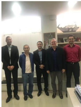
Termos de Acordo entre TJMA e IMESC – 23/04/2019