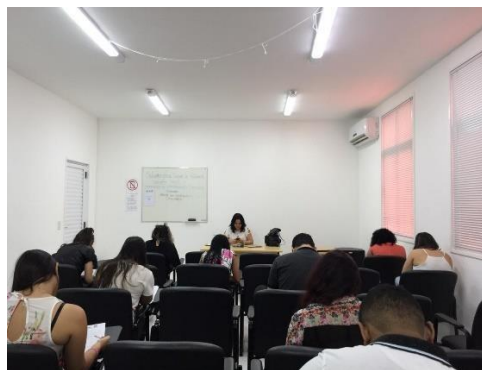
Seletivo para estágio na UMF – 30/04/2019