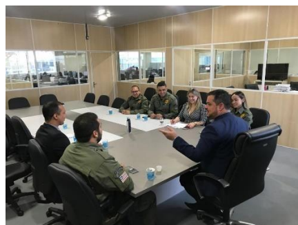
Reunião com a Juíza da Comarca de Coroatá – 16/04/2019