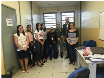
Inspeção na UPR de Coroatá - 21/03/2019