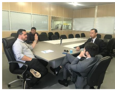
Reunião com o Juiz de Gov. Nunes Freire – 31/05/2019