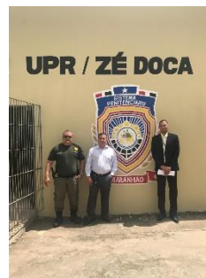
Inspeção na UPR de Zé Doca – 16/05/2019