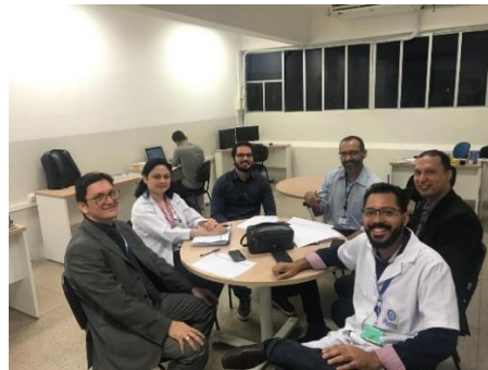
Reunião GT – Modelagem de Sistemas Complexos – 28/02/2019