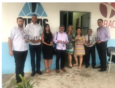
Reunião na APAC de Bacabal – 01/04/2019