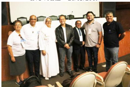
Curso de capacitação para presidentes das APAC's – 28/05/2019