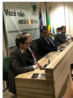
Solenidade de assinatura de Termo de Acordo para vagas de trabalho para Mulheres – 28/05/2019