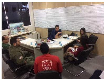
Reunião com a Juíza de Bacabal – 27/05/2019