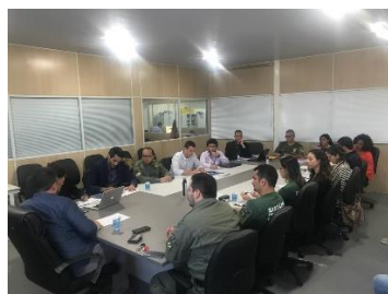
Apresentação do Programa Justiça presente á SEAP – 21/05/2019