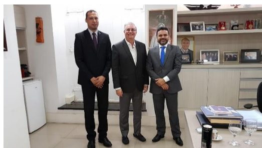
Visita do representante do Premio Innovare – 31/05/2019