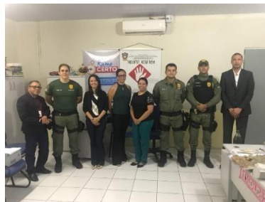
Inspeção na UPR de Codó – 21/03/2019