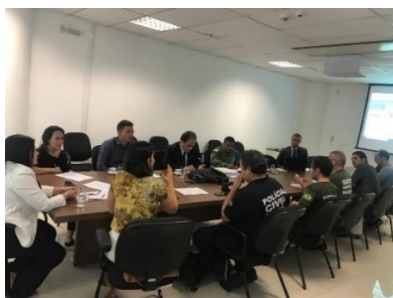
Reunião do GT Tornozeleiras – 27/03/2019