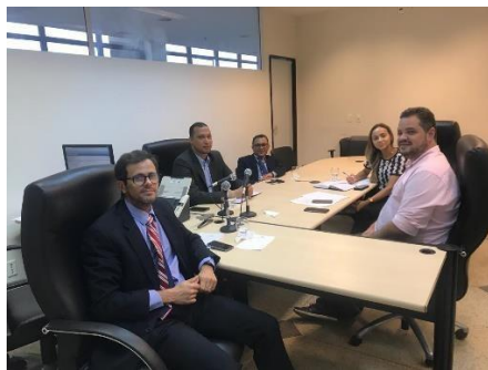
Reunião sobre a Regionalização – 13/03/2019