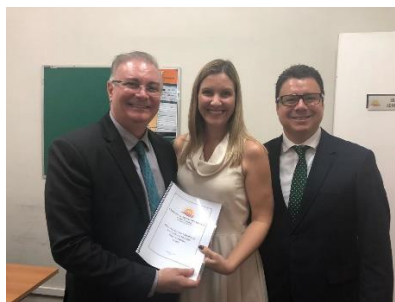
Entrega do Relatório aos Juizes responsáveis pelo Grupo de Análise de Presos Provisórios – GAPP – 20/05/2019.