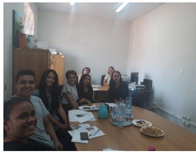
Treinamento com os estudantes de Direito da Universidade Ceuma – 23/05/2019