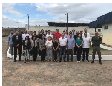
Visita de magistrados no Complexo Penitenciário 17/05/2019