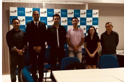
Elaboração do Planejamento Estratégico da UMF e melhorias dos diagnósticos e relatórios de trabalho – 22/04/2019