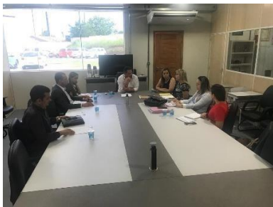
Reunião/Regionalização (Itapecuru-Mirim)– 15/03/2019