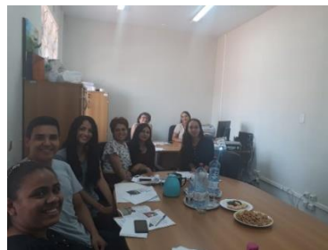
Treinamento com os estudantes de Direito da Universidade Ceuma – 23/05/2019