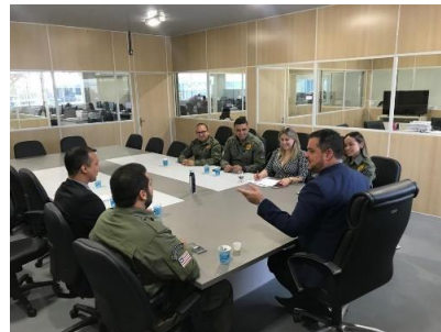
Reunião com a Juíza da Comarca de Coroatá – 16/04/2019