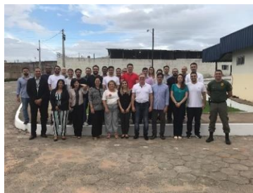
Visita de magistrados no Complexo Penitenciário 17/05/2019