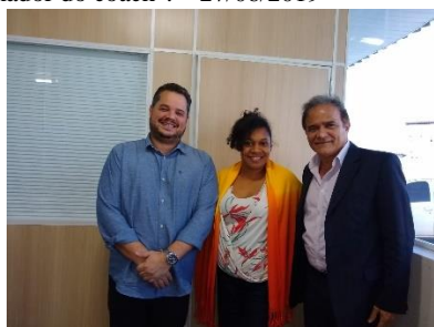
Reunião de organização do funcionamento da Central de Alternativas Penais entre o Executivo e o Judiciário – 27/06/2019