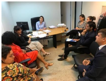
Visita da Equipe do PNUD/CNJ á Central de Inquéritos – 21/05/2019