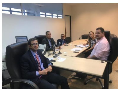
Reunião sobre a Regionalização – 13/03/2019