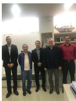
Termos de Acordo entre TJMA e IMESC – 23/04/2019