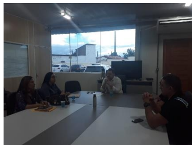
Reunião com a Juíza de Santa Inês – 07/06/2019