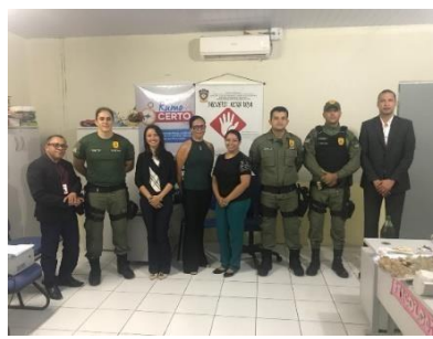
Inspeção na UPR de Codó – 21/03/2019