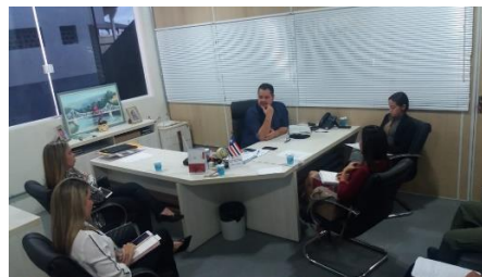
Reunião com a Juíza de Itapecuru-Mirim – 27/05/2019