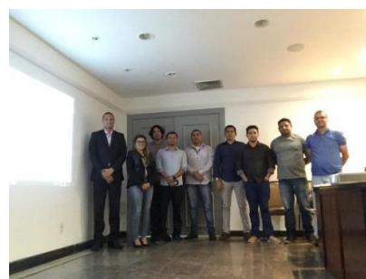
Reunião do GT Interoperabilidade de Sistemas - 25/04/2019