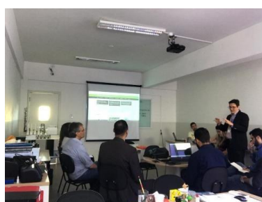
Reunião GT – Modelagem de Sistemas Complexos – 15/03/2019