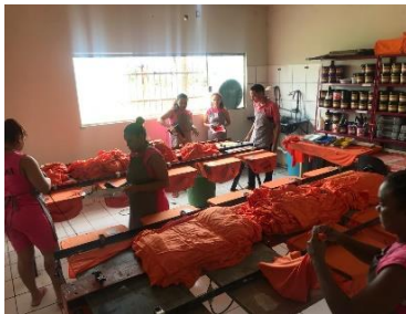
Visita da Equipe do PNUD/CNJ á malharia na Penitenciária feminina – 22/05/2019