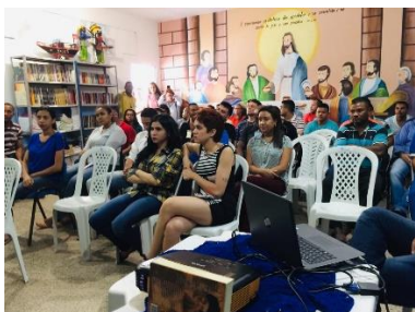
Visita dos Estagiários do curso de Direito do Ceuma à APAC – 05/06/2019