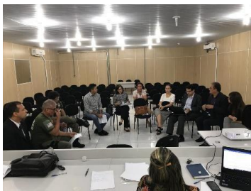
Reunião do GT - Tornozeleiras – 29/04/2019