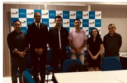
Elaboração do Planejamento Estratégico da UMF e melhorias dos diagnósticos e relatórios de trabalho – 22/04/2019