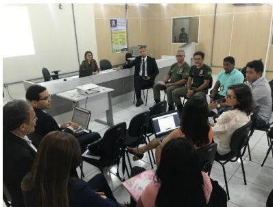
Reunião do GT Tornozeiras – 15/04/2019