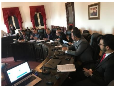
Apresentação do Programa Justiça Presenten – 20/05/2019