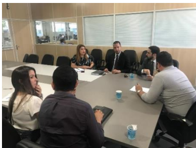
Reunião com a Juíza de Pedreiras – 31/05/2019