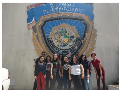
Visita dos Estagiários do curso de Direito do Ceuma ao Complexo Penitenciário São Luis – 26/06/2019