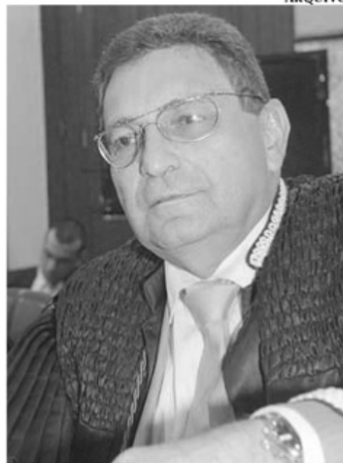
Bayma Araújo representará o presidente do TJ, Guerreiro Júnior

os presidentes debatem assuntos de interesse do Judiciário e firmam a posição dos tribunais de justiça na defesa de princípios institucionais. Durante os eventos, os magistrados promovem o intercâmbio de experiências administrativas e funcionais.