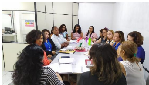
Reunião com a Funac, Umf e CNJ/PNUD – Apresentação do Programa Justiça Presente – 10/07/2019