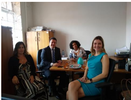
Reunião com o Grupo de Análise de Presos Provisórios – GAPP – 17/07/2019