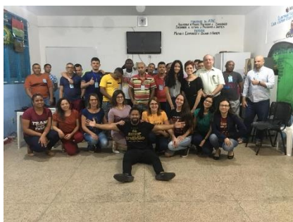
Estagiários da UMF participando da palestra "O poder transformador do coach". – 27/06/2019