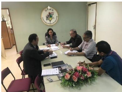
Reunião para tratar da pós em gestão Judiciária – 16/04/2019