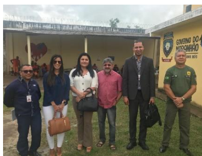
Inspeção na UPR de Bacabal – 21/03/2019