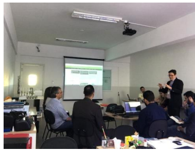
Reunião GT – Modelagem de Sistemas Complexos – 15/03/2019