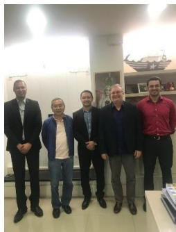
Termos de Acordo entre TJMA e IMESC – 23/04/2019