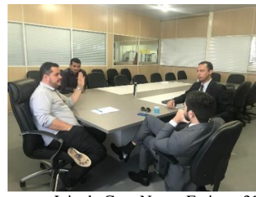
Reunião com o Juiz de Gov. Nunes Freire – 31/05/2019