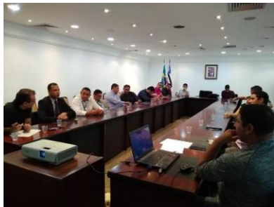
Reunião GT – Interoperabilidade – 27/02/2019