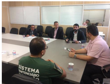
Reunião com o Juiz da Comarca de açailândia – 30/07/2019