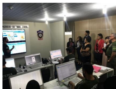
Visita da Equipe do PNUD/CNJ à Supervisão de Monitoração Eletrônica – 20/05/2019