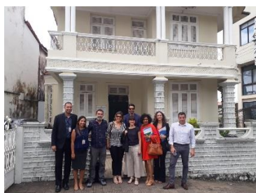
Visita da Equipe do PNUD/CNJ à Unidade de Monitoramento do Sistema Carcerario – UMF – 21/05/2019