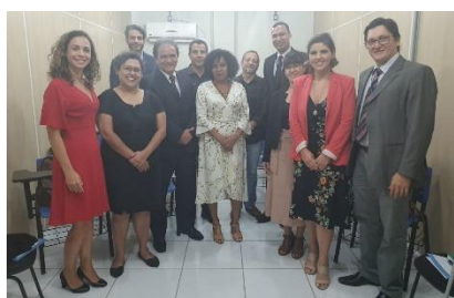
Apresentação do Observatório de Direitos Humanos – ODH à Equipe do PNUD/CNJ – 20/05/2019