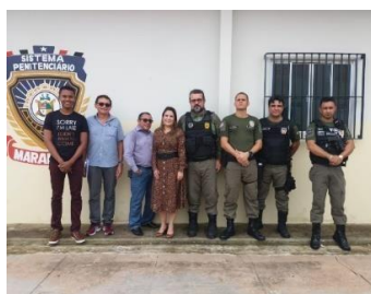
Inspeção na UPR de Pinheiro – 11/04/2019