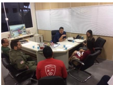
Reunião com a Juíza de Bacabal – 27/05/2019