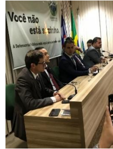
Solenidade de assinatura de Termo de Acordo para vagas de trabalho para Mulheres – 28/05/2019