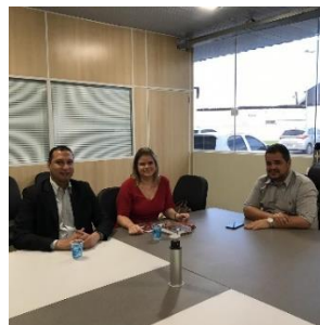
Reunião com a Juíza de Presidente Dutra – 31/05/2019