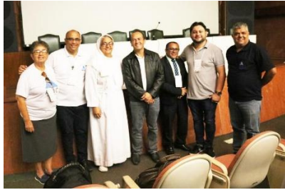
Curso de capacitação para presidentes das APAC's – 28/05/2019