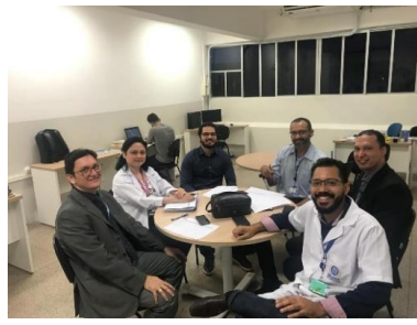
Reunião GT – Modelagem de Sistemas Complexos – 28/02/2019