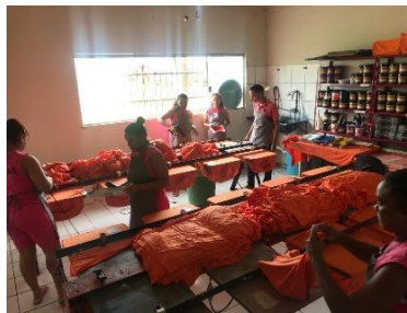
Visita da Equipe do PNUD/CNJ á malharia na Penitenciária feminina – 22/05/2019