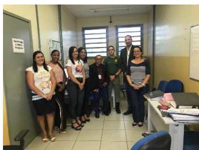
Inspeção na UPR de Coroatá - 21/03/2019