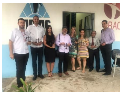
Reunião na APAC de Bacabal – 01/04/2019