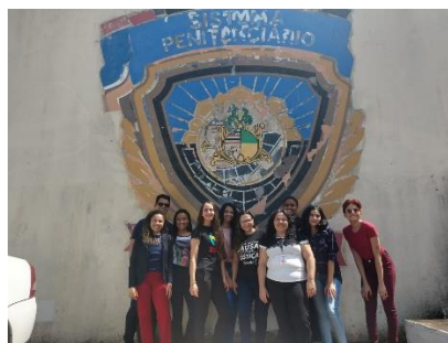
Visita dos Estagiários do curso de Direito do Ceuma ao Complexo Penitenciário São Luis – 26/06/2019