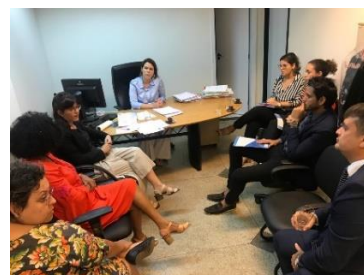
Visita da Equipe do PNUD/CNJ à Central de Inquéritos – 21/05/2019