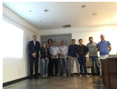
Reunião do GT Interoperabilidade de Sistemas - 25/04/2019