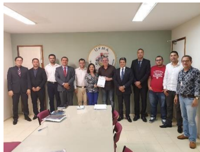
Termo de acordo – Observatório de Direitos Humanos – 16/04/2019