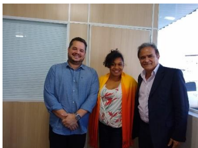
Reunião de organização do funcionamento da Central de Alternativas Penais entre o Executivo e o Judiciário – 27/06/2019