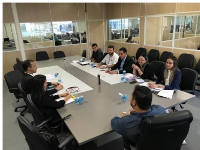
Reunião para tratar da reforma da Unidade Prisional e fábrica de Blocos e APAC de Bacabal - 22/04/2019