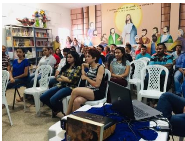
Visita dos Estagiários do curso de Direito do Ceuma à APAC – 05/06/2019