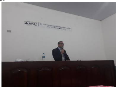
Presidente da APAC/São Luis ministrando palestra na APAC de Itapecuru-Mirim – 10/07/2019