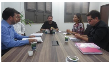
Reunião entre Setres, UMF e SEAP – 10/04/2019