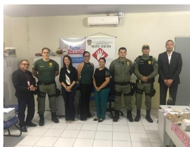
Inspeção na UPR de Codó – 21/03/2019