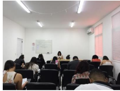
Seletivo para estágio na UMF – 30/04/2019