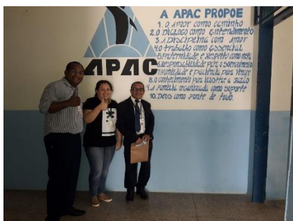
Inspeção na APAC – 25/06/2019