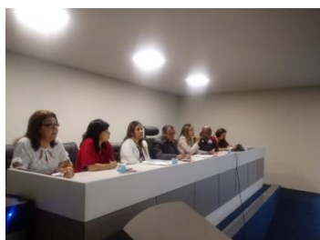
3ª Cerimônia do Livramento Condicional – 24/05/2019