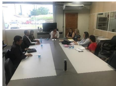
Reunião/Regionalização (Itapecuru-Mirim)– 15/03/2019