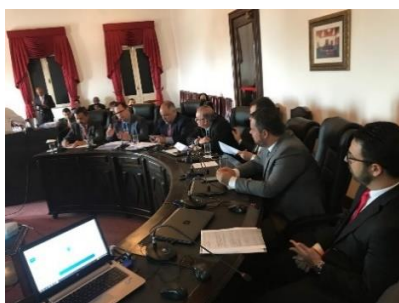
Apresentação do Programa Justiça Presenten – 20/05/2019

Inspeção na UPR de Santa Inês – 16/05/2019