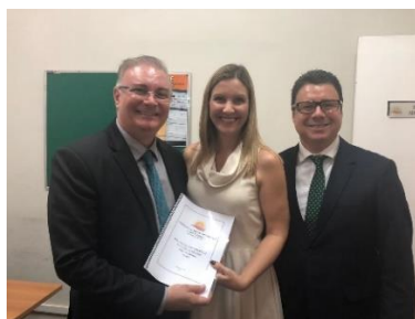
Entrega do Relatório aos Juizes responsáveis pelo Grupo de Análise de Presos Provisórios – GAPP – 20/05/2019.

Visita de magistrados no Complexo Penitenciário 17/05/2019