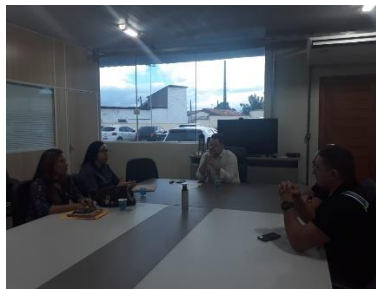
Reunião com a Juíza de Santa Inês – 07/06/2019