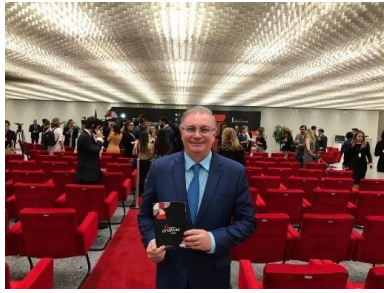
Participação do Des. Fros sobrinho na abertura do INOVARE – 21/03/2019