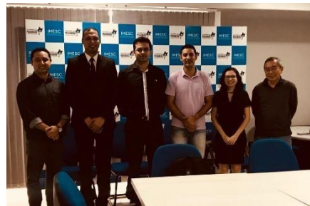
Elaboração do Planejamento Estratégico da UMF e melhorias dos diagnósticos e relatórios de trabalho – 22/04/2019