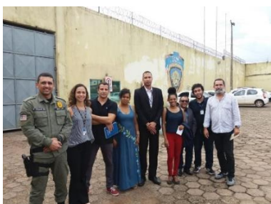
Visita da Equipe do PNUD/CNJ ao Complexo Penitenciário São Luis – 22/05/2019