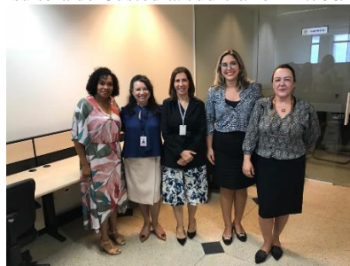
Apresentação do Programa Justiça Presente à Diretoria do Fórum – 04/07/2019