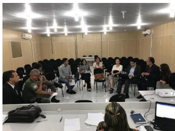
Reunião do GT - Tornozeleiras – 29/04/2019