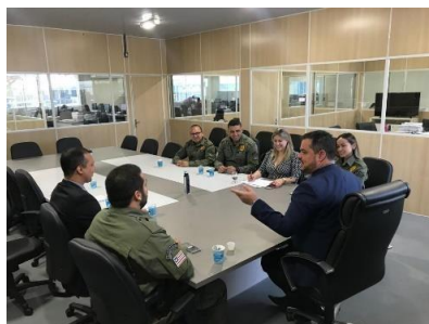
Reunião com a Juíza da Comarca de Coroatá – 16/04/2019