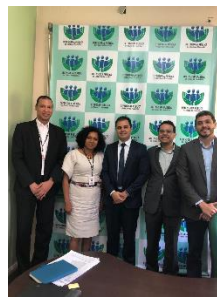
Reunião com as Consultoras do Programa Justiça Presente – CNJ/PNUD – 30/07/2019