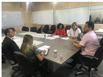
Apresentação do Programa Justiça Presente – CNJ/PNUD à SEAP – 30/07/2019