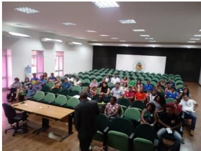
1ª Cerimônia de Livramento Condicional 2019 – 28/01/2019