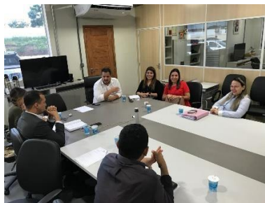
Reunião/Regionalização (Viana)– 15/03/2019