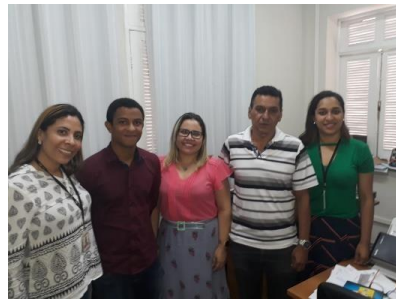
Reunião com a Equipe Técnica da Supervisão Psicossocial da SEAP – 19/02/2019