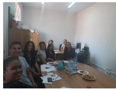
Treinamento com os estudantes de Direito da Universidade Ceuma – 23/05/2019