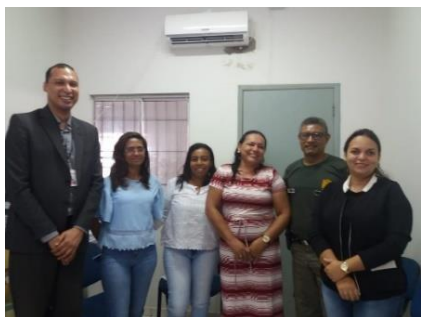
Inspeção na UPR de Pedreiras – 21/03/2019