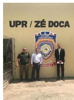
Inspeção na UPR de Zé Doca – 16/05/2019