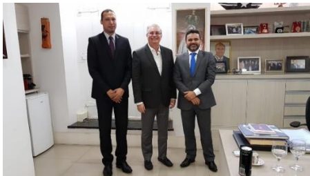
Visita do representante do Premio Innovare – 31/05/2019