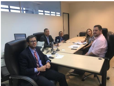
Reunião sobre a Regionalização – 13/03/2019