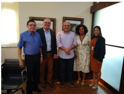
Reunião com o TJMA e a Casa Civil – 17/09/2019