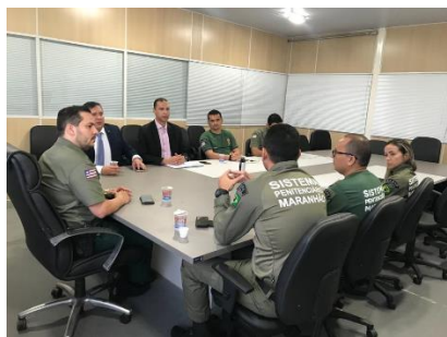
Reunião com o Juiz da Comarca de Zé Doca – 23/08/2019