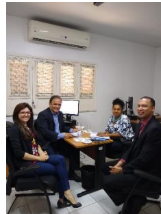
Reunião com o Juiz da 2ª VEP de São Luis – 13/08/2019