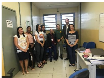
Inspeção na UPR de Coroatá - 21/03/2019