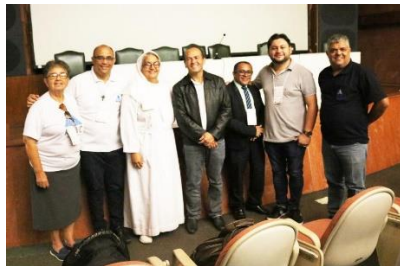
Curso de capacitação para presidentes das APAC's – 28/05/2019