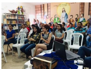
Visita dos Estagiários do curso de Direito do Ceuma à APAC – 05/06/2019