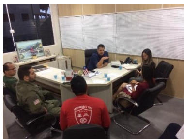
Reunião com a Juíza de Bacabal – 27/05/2019