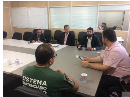
Reunião com o Juiz da Comarca de açailândia – 30/07/2019