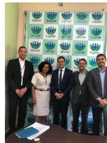
Reunião com as Consultoras do Programa Justiça Presente – CNJ/PNUD – 30/07/2019