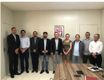
Proposta de Parceria entre o TJMA e o IMESC – 30/09/2019