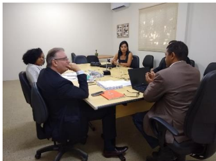
Reunião com o Juiz da Vara da Infância e da Juventude da Comarca de Imperatriz – 09/08/2019