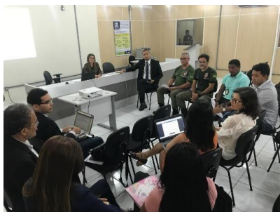
Reunião do GT Tornozeleiras – 15/04/2019