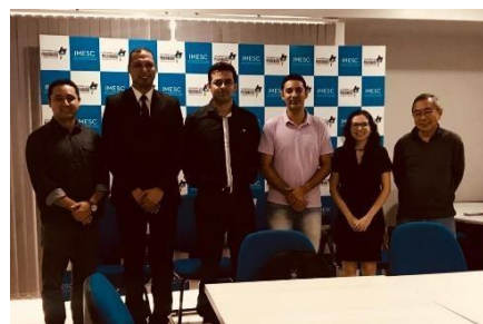
Elaboração do Planejamento Estratégico da UMF e melhorias dos diagnósticos e relatórios de trabalho – 22/04/2019