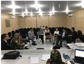
Reunião do GT - Tornozeleiras – 29/04/2019