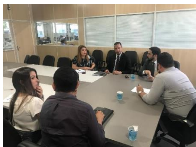
Reunião com a Juíza de Pedreiras – 31/05/2019