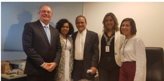
Reunião para discutir o funcionamento da CIAPS – 02/08/2019