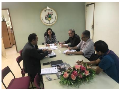
Reunião para tratar da pós em gestão Judiciária – 16/04/2019