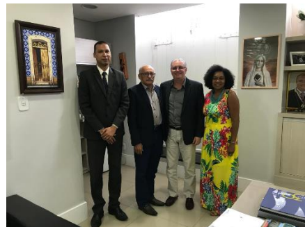
Reunião sobre Medidas Socioeducativas – 19/09/2019