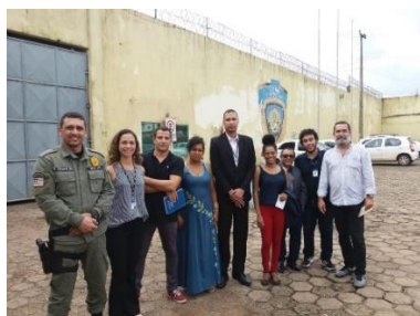
Visita da Equipe do PNUD/CNJ ao Complexo Penitenciário São Luis – 22/05/2019