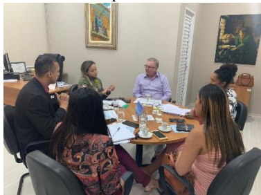
Reunião para discutir o fluxo de empregabilidade para egressos - 13/08/2019