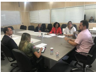
Apresentação do Programa Justiça Presente – CNJ/PNUD à SEAP – 30/07/2019