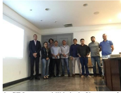
Reunião do GT Interoperabilidade de Sistemas - 25/04/2019