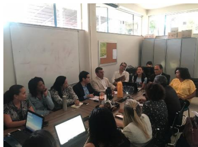
Reunião – Saúde Mental - e apresentação do relatório do HNR