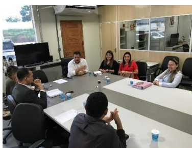
Reunião/Regionalização (Viana)– 15/03/2019