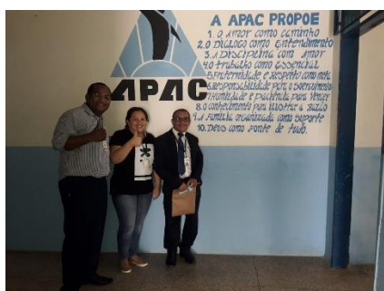
Inspeção na APAC – 25/06/2019