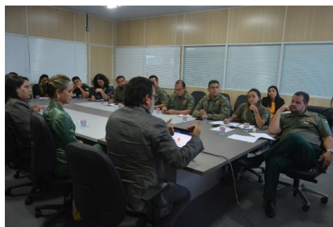
Proposta de Parceria com o Humanitas 360 – 25/09/2019