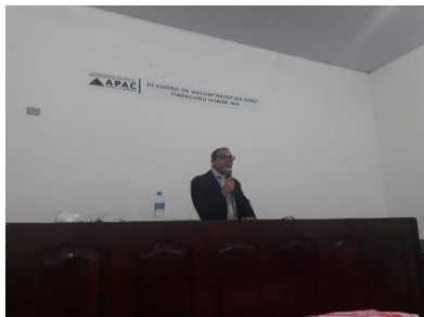
Presidente da APAC/São Luis ministrando palestra na APAC de Itapecuru-Mirim – 10/07/2019