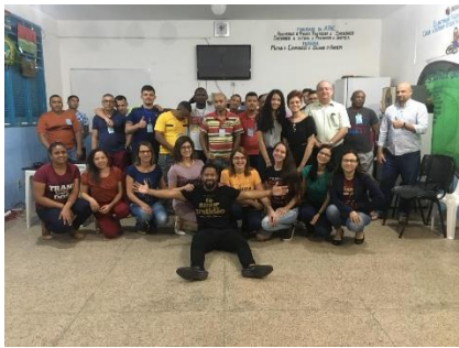
Estagiários da UMF participando da palestra "O poder transformador do coach". – 27/06/2019