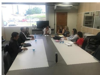
Reunião/Regionalização (Itapecuru-Mirim)– 15/03/2019