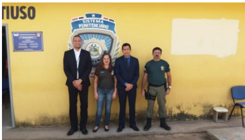
Inspeção na UPR de Santa Inês – 16/05/2019