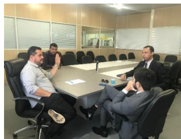
Reunião com o Juiz de Gov. Nunes Freire – 31/05/2019