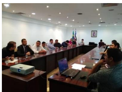
Reunião GT – Interoperabilidade – 27/02/2019