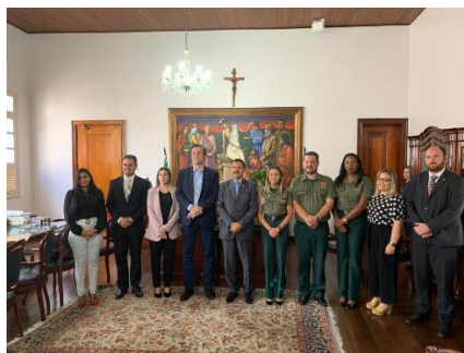
Assinatura do Termo de Acordo entre TJMA, DEPEN, SEAP e DPE – 27/09/2019