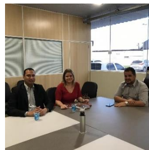
Reunião com a Juíza de Presidente Dutra – 31/05/2019