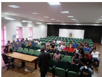
1ª Cerimônia de Livramento Condicional 2019 – 28/01/2019