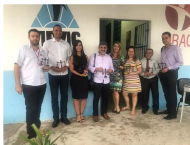
Reunião na APAC de Bacabal – 01/04/2019