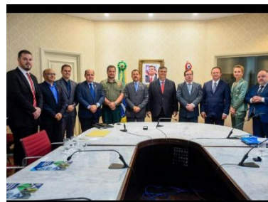
Assinatura do Termo de Acordo entr o TJMA, Governo do Estado, CNJ e Instituto Humanitas 360 – 26/09/2019