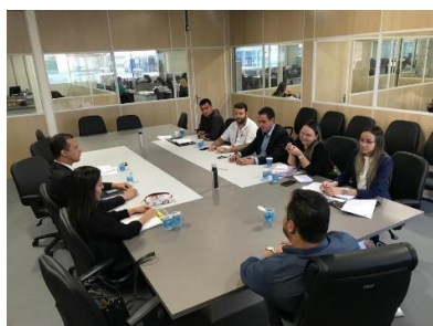
Reunião para tratar da reforma da Unidade Prisional e fábrica de Blocos e APAC de Bacabal - 22/04/2019