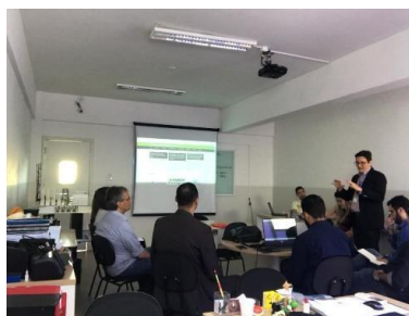
Reunião GT – Modelagem de Sistemas Complexos – 15/03/2019