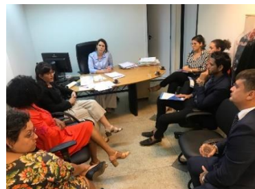
Visita da Equipe do PNUD/CNJ à Central de Inquéritos – 21/05/2019