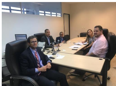
Reunião sobre a Regionalização – 13/03/2019