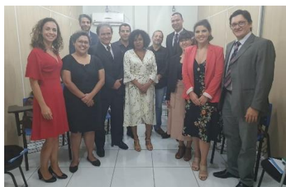
Apresentação do Observatório de Direitos Humanos – ODH à Equipe do PNUD/CNJ – 20/05/2019