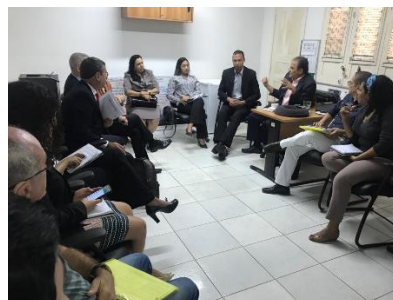
Reunião com a Rede de Saúde Mental do Maranhão – 20/08/2019