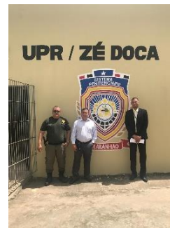
Inspeção na UPR de Zé Doca – 16/05/2019