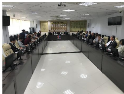
Reunião GT Interoperabilidade de Sistemas – 17/09/2019