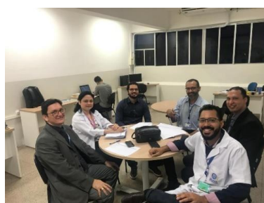
Reunião GT – Modelagem de Sistemas Complexos – 28/02/2019