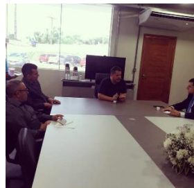
Reunião com o Juiz da Comarca de Barra do Corda – 09/08/2019