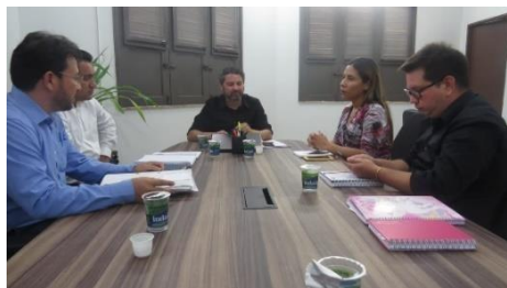
Reunião entre Setres, UMF e SEAP – 10/04/2019