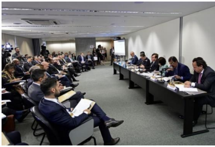
Participação do Des. Fros Sobrinho no debate sobre o Projeto de Lei Anticrime – 14/02/2019