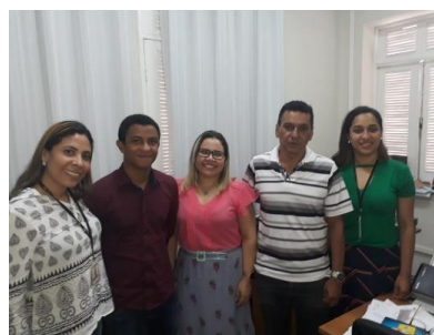
Reunião com a Equipe Técnica da Supervisão Psicossocial da SEAP – 19/02/2019