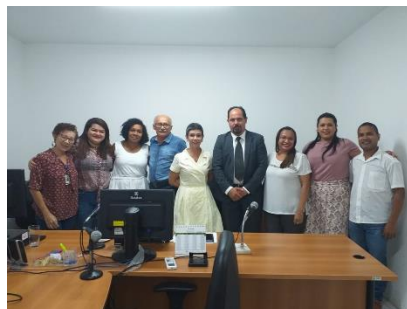
Reunião com as instituições que integram o Centro Integrado de Juventude – CIJUV/NAI – 23/08/2019