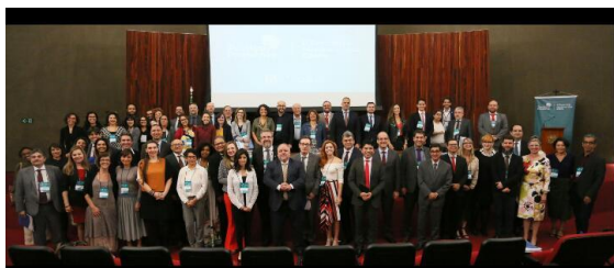
Encontro dos Grupos de Monitoramento Carcerário do CNJ – 26/09/2019