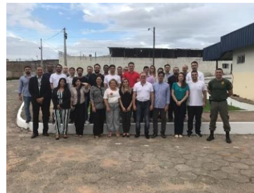
Visita de magistrados no Complexo Penitenciário 17/05/2019