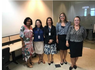
Apresentação do Programa Justiça Presente à Diretoria do Forum – 04/07/2019