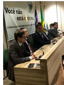
Solenidade de assinatura de Termo de Acordo para vagas de trabalho para Mulheres – 28/05/2019