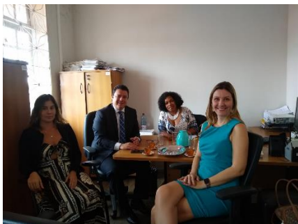
Reunião com o Grupo de Análise de Presos Provisórios – GAPP – 17/07/2019