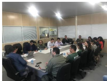
Apresentação do Programa Justiça presente à SEAP – 21/05/2019