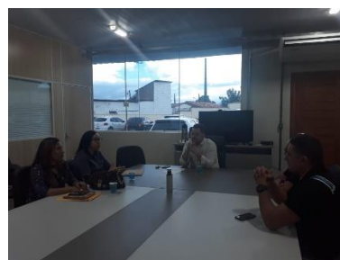
Reunião com a Juíza de Santa Inês – 07/06/2019