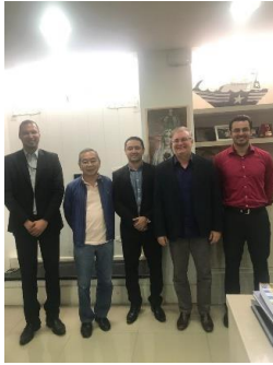
Termos de Acordo entre TJMA e IMESC – 23/04/2019