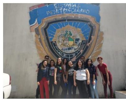
Visita dos Estagiários do curso de Direito do Ceuma ao Complexo Penitenciário São Luis – 26/06/2019