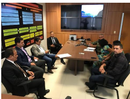
Reunião GT Monitoração Eletrônica – 23/09/2019