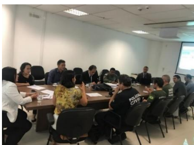
Reunião do GT Tornozeiras – 27/03/2019