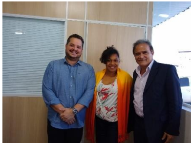
Reunião de organização do funcionamento da Central de Alternativas Penais entre o Executivo e o Judiciário – 27/06/2019