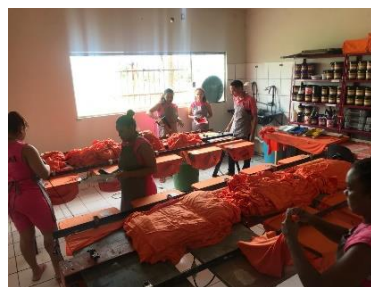
Visita da Equipe do PNUD/CNJ à malharia na Penitenciária feminina – 22/05/2019