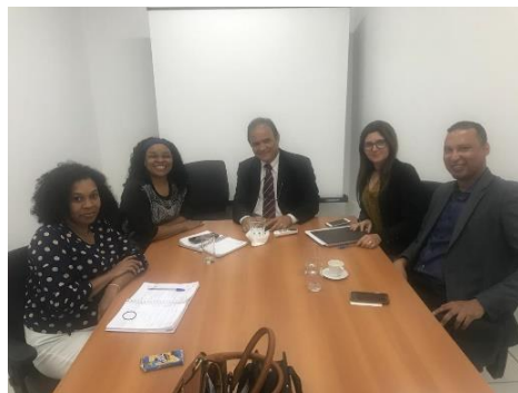
Programa de Atenção à Saúde Mental do Maranhão – 09/01/2020