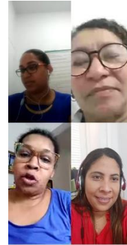
Alinhamento da Resolução 307 do CNJ (Política de Atenção ao Egresso) – 08/04/2020