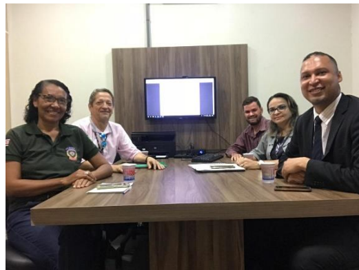
Reunião com a Coordenação de Saúde da SEAP – 28/01/2020