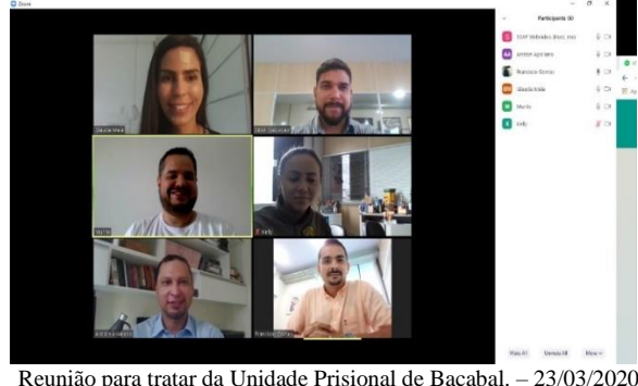
Reunião para tratar da Unidade Prisional de Bacabal. – 23/03/2020