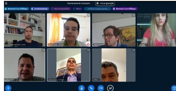
2ª Reunião do Comitê Covid-10 – Prisões – 28/04/2020