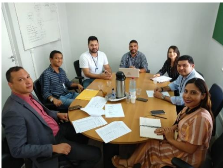
Reunião com o GT Biometria – 10/01/2020