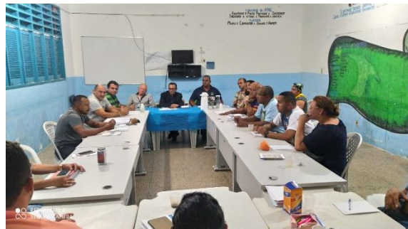
Reunião na Apac de São Luis com a Presença do Conselho Fiscal – 13/01/2020