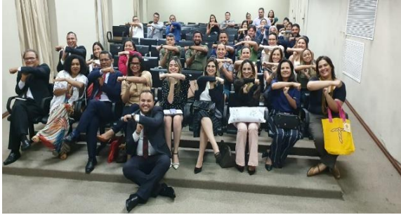
Apresentação das Ações da Humanitas 360 no Maranhão – 16/01/2020

Reunião para tratar do treinamento SEEU – 16/01/2020