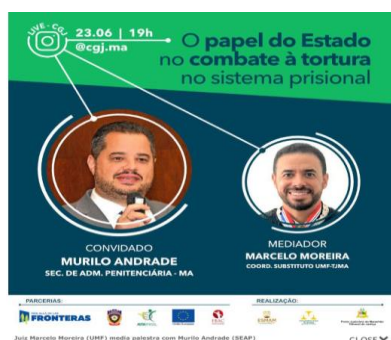
Palestra sobre o papel do Estado no combate à tortura no sistema prisional – 23/06/2020