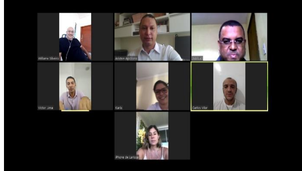
1ª Reunião por meio da Webconferencia para traçarmos medidas de minimizar os efeitos do covid-19 dentro da Unidade Prisionais – 23/03/2020