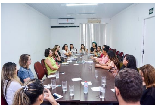
Parceria Humanitas – 22/01/2020