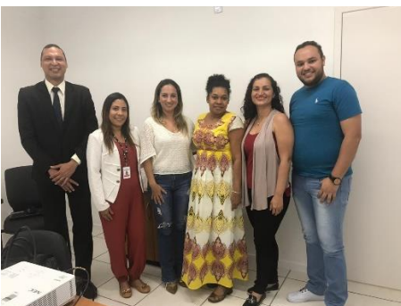
Implantação da Unidade Produtiva no Estado pela Associação Cooperativista Maranhense Cuxá, instalada na Unidade Feminina