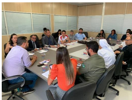
Reunião para tratar dos novos desafios para as Apac's em 2020 – 08/01/2020