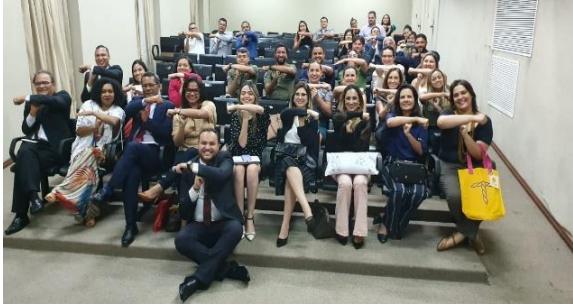
Apresentação das Ações da Humanitas 360 no Maranhão – 16/01/2020