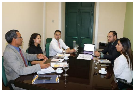
Parceria Humanitas 360 – 23/01/2020