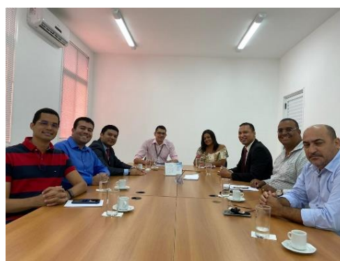
Reunião para tratar do treinamento SEEU – 16/01/2020