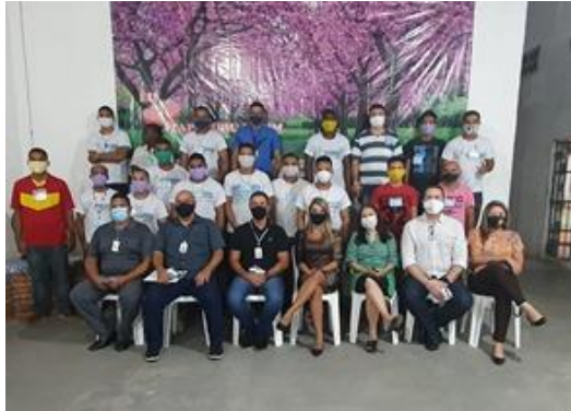
Inspeção na Associação de Proteção e Assistência aos Condenados de Itapecuru Mirim (APAC) – 25/08/2020