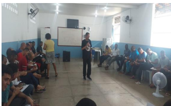
Trabalho de Ressocialização na APAC São Luis – 11/03/2020