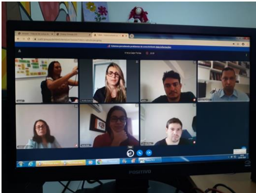
Reunião para tratar Unidade Prisional de Itapecuru-Mirim – 23/03/2020