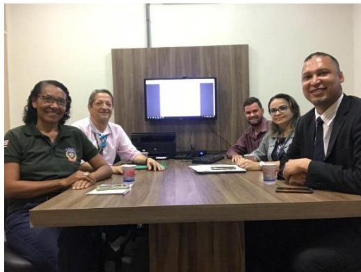
Reunião com a Coordenação de Saúde da SEAP – 28/01/2020