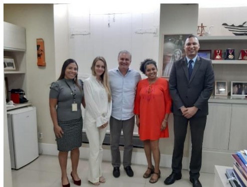
Reunião de apresentação da nova consultora de Audiência de Custódia – 04/03/2020