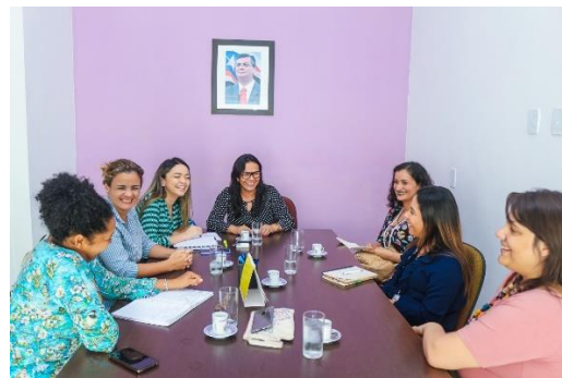
Parceria Humanitas 360 – 20/01/2020