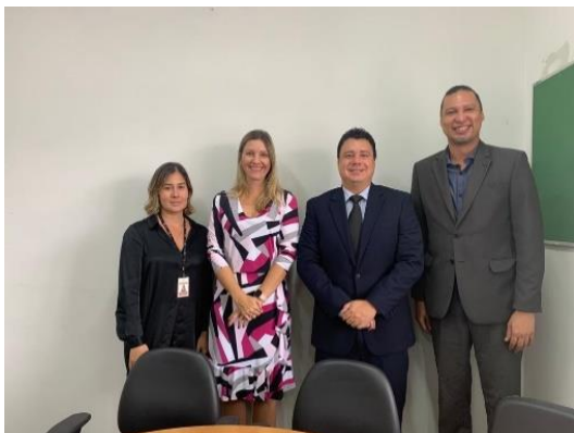
GAPP e Cronograma 2020 – 24/01/2020