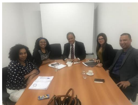
Programa de Atenção à Saúde Mental do Maranhão – 09/01/2020