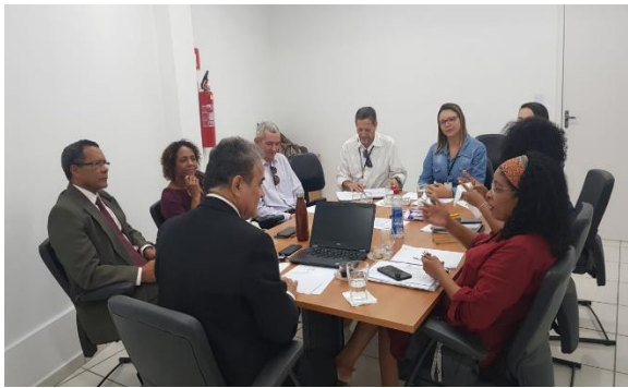
Reunião do Grupo de Trabalho PAI-MA – 11/03/2020