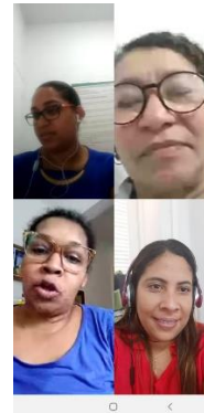
Alinhamento da Resolução 307 do CNJ (Política de Atenção ao Egresso – 08/04/2020