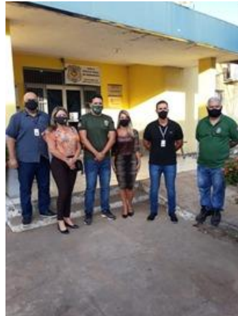
Inspeção na Unidade Prisional de Itapecuru-Mirim – UPITP – 24/08/2020