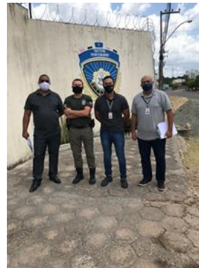
Inspeção na Unidade Prisional de Chapadina – UPPCHA – 26/08/2020