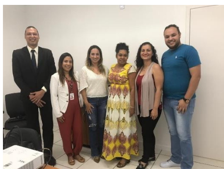
Implantação da Unidade Produtiva no Estado pela Associação Cooperativista Maranhense Cuxá, instalada na Unidade Feminina