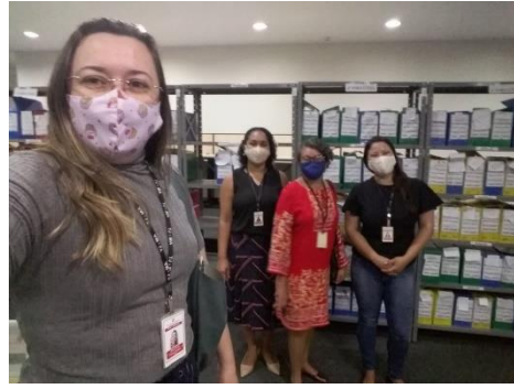
Visita do PCN ao Forum José Sarney – Projero Digitalizar Já – Fiscalização de Convênio – 06/08/2020