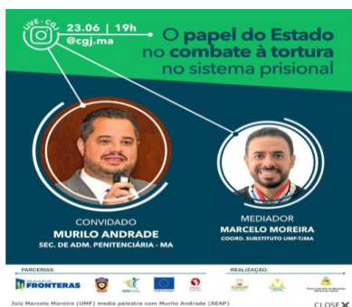
Palestra sobre o papel do Estado no combate à tortura no sistema prisional – 23/06/2020