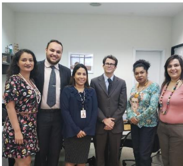
Parceria Humanitas – 20/01/2020