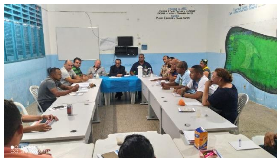
Reunião na Apac de São Luis com a Presença do Conselho Fiscal – 13/01/2020