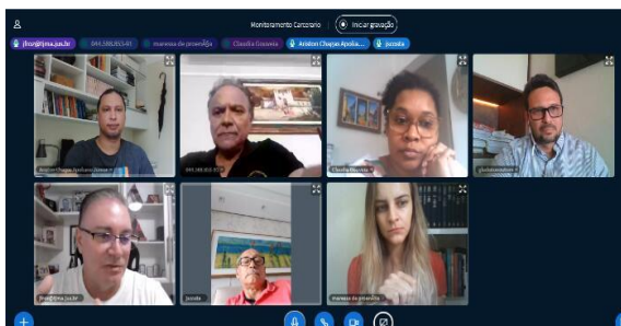
1ª Reunião CNJ Justiça Presente, UMF, TJMA e CGJ – 05/05/2020