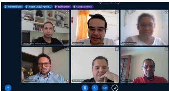
2ª Reunião do Comitê Covid-10 – Prisões – 28/04/2020