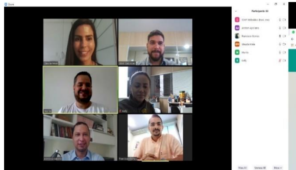
Reunião para tratar da Unidade Prisional de Bacabal. – 23/03/2020