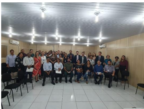
Revisão do Fluxo para Implementação da Lei. 10.182-14 e Minuta do Decreto – 30/01/2020