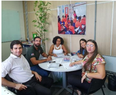
Construção do Fluxo da Lei 10.182/2014 – 17/01/2020