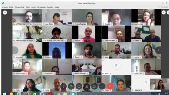
1ª Reunião GMF 2020 – 15/06/2020