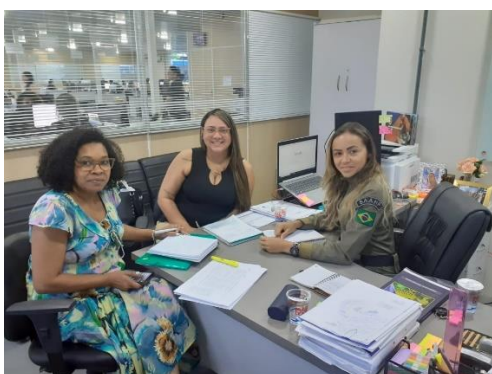
Reunião para realinhar as ações do Programa Justiça Presente 18/02/2020