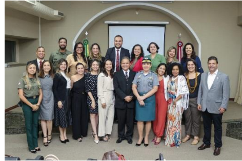
Parceria Humanitas – 16/01/2020