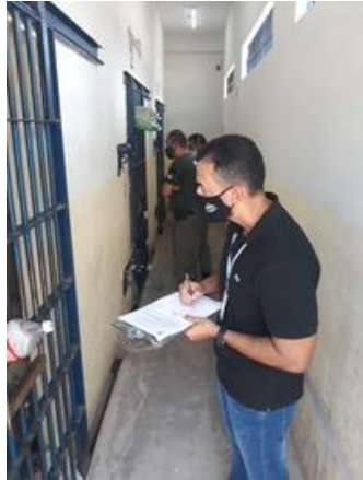
Inspeção na Unidade Prisional de Rosário – UPROS – 24/08/2020