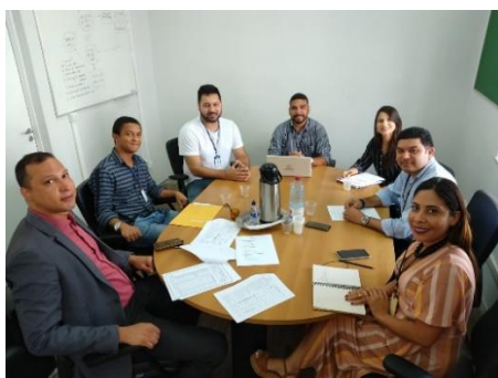
Reunião com o GT Biometria – 10/01/2020