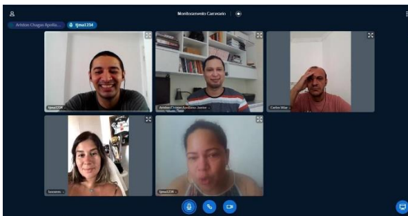
Reunião Com Servidores da UMF – 07/05/2020