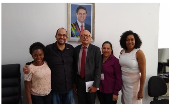
Reunião para discutir o Atendimento SocioEducativo em Meio Aberto de São Luis e sua Implementação 14/02/2020