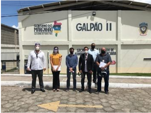
Inspeção na Unidade Prisional São Luis 4 – 22/07/2020