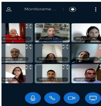
2ª Reunião por meio da Webconferencia para traçarmos medidas de minimizar os efeitos do covid-19 dentro da Unidade Prisionais – 25/03/2020