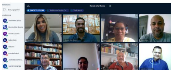
Reunião para tratar sobre a pandemia no sistema socioeducativo – 08/07/2020