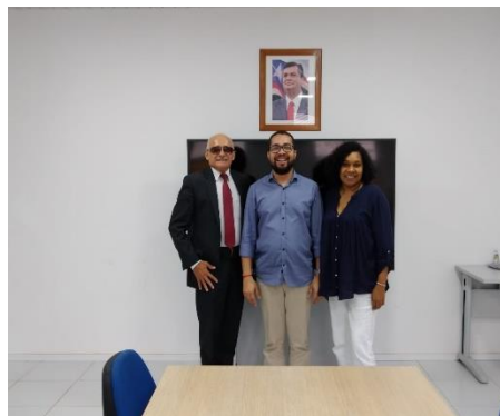
Reunião para construir parcerias para a realização de cursos profissionalizantes para adolescentes em conflito com a Lei 17/02/2020