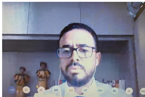
Webnário Regional sobre o enfrentamento à Covid-19 no sistema penal e socioeducativo – 15/07/2020