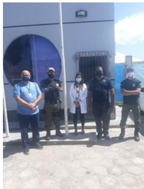
Inspeção na Unidade Prisional de Tutoia – UPTTA – 27/08/2020