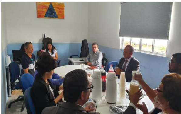
Reunião com o Conselho Penitenciário e Equipe Multiprofissional da APAC 06/02/2020