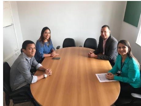
Reunião com o Grupo Biometria – 17/01/2019