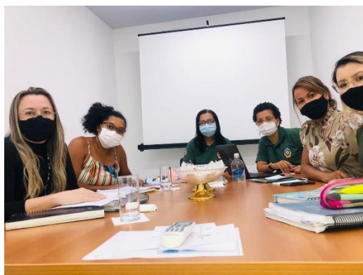
Reunião com CIAPIS para construir o trabalho de atenção a pessoa pré egressa e suas famílias – 21/01/2021