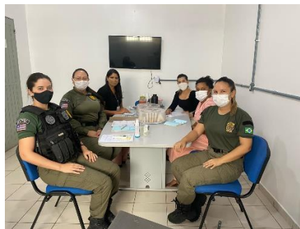
Reunião na Unidade feminina para tartar sobre a saúde mental, situação das mulheres encarceradas e dia internacional da mulher – 11/02/2021