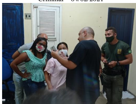
Divulgação do chatbot em Unidades Prisionais – 05/02/2021