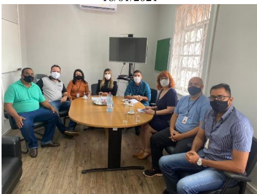
Reunião para tratar do Projeto presos provisórios – 20/01/2021