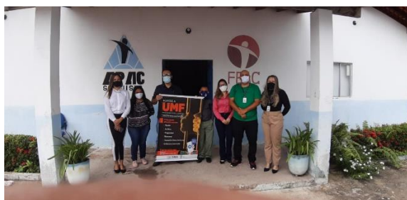
Divulgação chatbot na Apac de São Luis – 21/01/2021