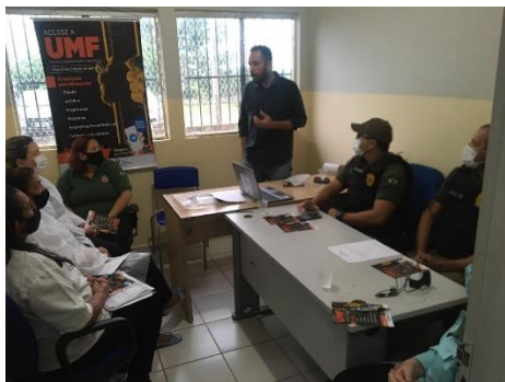
Divulgação do chatbot no período de 08 a 12/02 nas Comarcas de Coroatá, Codó, Caxias e Timon