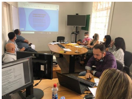
Planejamento de atividades da UMF para 2021 – 18/01/2021