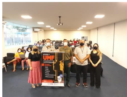
Divulgação do Chatbot Sisumf na SEAP – 19/01/2021