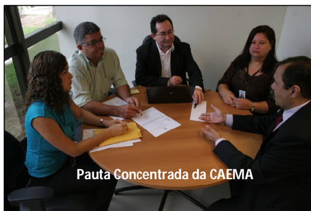
Pauta Concentrada da CAEMA

Pautas Específicas – Com o fito de fomentar uma cultura de paz, de divulgar os serviços dos Cejuscs e de apoiar as atividades de diversas unidades jurisdicionais, os Cejuscs realizaram diversas pautas concentradas, destacando-se as seguintes: 1ª Semana Especial da