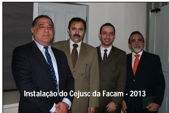
Instalação do Cejusc da Facam - 2013

Formação de Conciliadores. Por fim, no período de 14 a 25 de outubro, em Caxias, realizou-se capacitação em conciliação para uma turma de 30 voluntários, os quais atuarão nos Cejuscs da mencionada localidade.