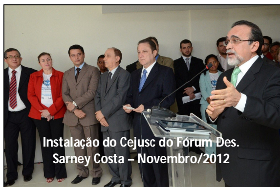
Instalação do Cejuscs do Fórum Des. Sarney Costa – Novembro/2012

Instalação de Cejuscs – No dia 3 de setembro de 2012, foi instalado um Centro Judiciário de Solução de Conflitos e Cidadania em Imperatriz, no campus da Facimp – Faculdade de Imperatriz. Em 12 de novembro desse mesmo ano, foram inaugurados os Centros localizados no Fórum Desembargador Sarney Costa (Calhau) e na Rua do Egito (Centro) de São Luís. Na data de 13 de novembro, foram instalados os Cejuscs dos campi I e II do Centro Universitário do Maranhão (CEUMA), localizados nos bairros ludovicenses do Renascença e da Cohama, respectivamente.