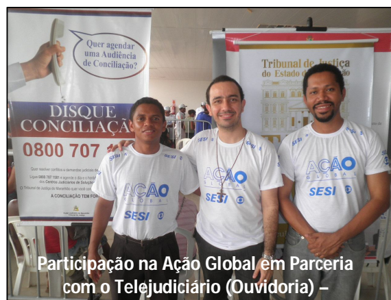
Participação na Ação Global em Parceria com o Telejudiciário (Ouvidoria) –

Ação Global – Em 18 de maio de 2013, o Núcleo participou da Ação Global, ocorrida na Cidade Universitária do Campus do Bacanga, realizando o agendamento de audiências de conciliação e esclarecendo a população a respeito dos métodos consensuais de solução de conflitos.