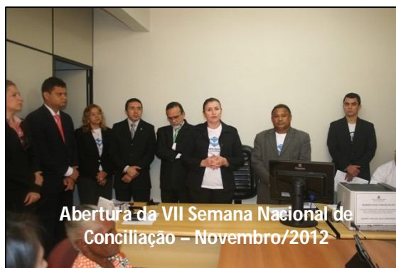
Abertura da VII Semana Nacional de Conciliação – Novembro/2012

Semana Nacional de Conciliação – No período de 7 a 14 de novembro, o Núcleo participou da VII Semana Nacional de Conciliação, apoiando a realização de audiências de conciliação da 4ª Vara de Família da Comarca de São Luís, mediante a cessão temporária de servidores capacitados em métodos consensuais de solução de conflitos.