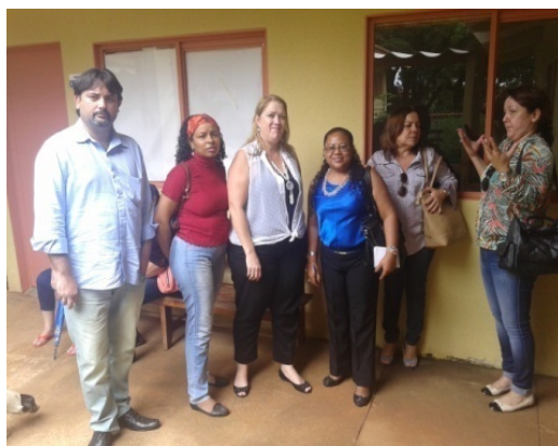
Visita ao Centro de Atenção Psicossocial Novo Mundo – 28/11/2014.