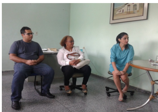
Visita ao Pronto Socorro Psiquiátrico Wassily Chuc- 28/11/2014