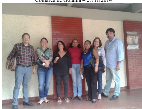
Visita ao Ambulatório Municipal de Psiquiatria de Goiânia – 28/11/2014