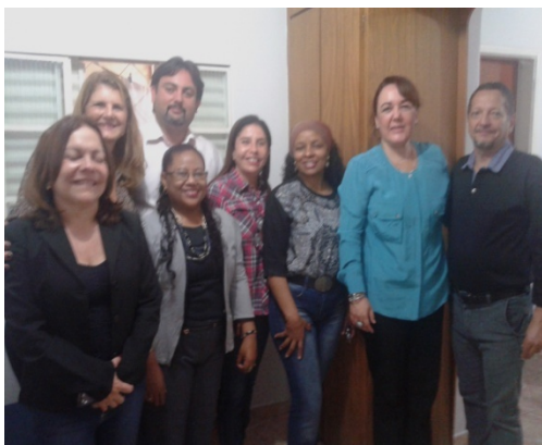
Visita ao PAILI – 27/11/2014

OBJETIVO: Conhecer a estrutura e o funcionamento do modelo de atenção às pessoas em sofrimento psíquico em conflito com a Lei que é referência nacional na efetivação da Lei 10216/2001, o Programa PAILI.