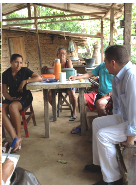
Visitas domiciliares do dia 12 de novembro de 2014.