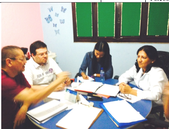
Reunião no CAPS AD MUNICIPAL, 08 de outubro de 2014.