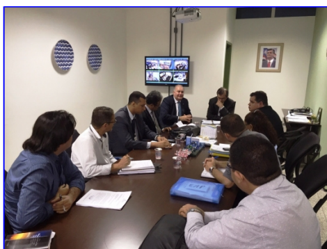
Reunião de 28 de maio de 2015