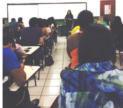
Minicurso Avaliação Psicossocial no contexto da Psicologia Jurídica no UNICEUMA, 24 de outubro de 2014.