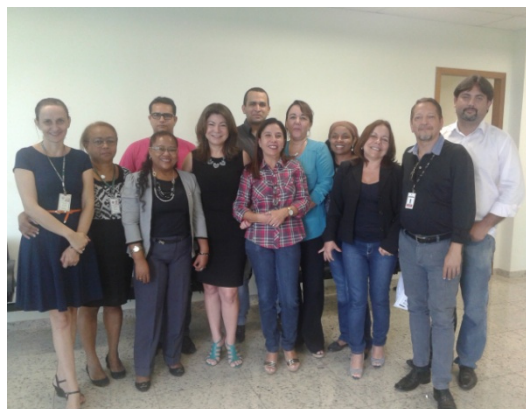
Visita à 1ª Vara de Penas Alternativas e Medidas de Segurança da Comarca de Goiânia – 27/11/2014